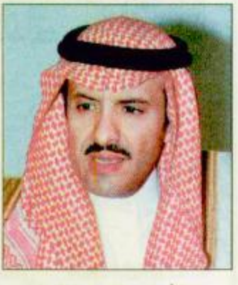
الأمير سلطان بن سلمان السيدوهي أمين عام مسابقة القرآن الكريم الدولية للشؤون الإسلامية والأوقات مسابقة الأمير سلطان بن سلمان لحفظ القرآن الكريم بأنها ذات أهداف نبيلة وتربية إسلامية صحيحة ووسيلة هامة من وسائط العلاج النفسي والتربوي لتلك الفئة من أبنائنا الأ وهم الأطفال المعوقون

الرياض - عمر اللحيان: أعلن عبدالله بن محمد آل الشيخ عضو مجلس إدارة جمعية الأطفال المعوقين وأمين عام مسابقة الأمير سلطان بن سلمان لحفظ القرآن الكريم للأطفال المعوقين عن تأجيل بدء فعاليات الدورة الرابعة من المسابقة لتتطابق بمشيئة الله في السادس من شهر ذي القعدة القادم.