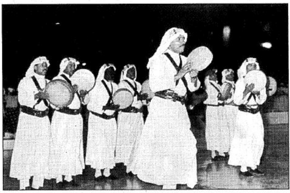
الفنون الشعبية لها نصيب في المهرجان

ندوة الإسلام والغرب وفي 1416/10/17هـ ونياً من خادم الحرمين الشريفين الملك فهد بن عبدالعزيز رعى صاحب السمو الملكي الأمير عبدالله بن عبدالعزيز ولي العهد ونائب رئيس مجلس الوزراء ورئيس الحرس الوطني حفل افتتاح المهرجان الوطني الحادي عشر للتراث والثقافة. وقد شملت نشاطات هذا المهرجان جوانب متعددة في مسابقة