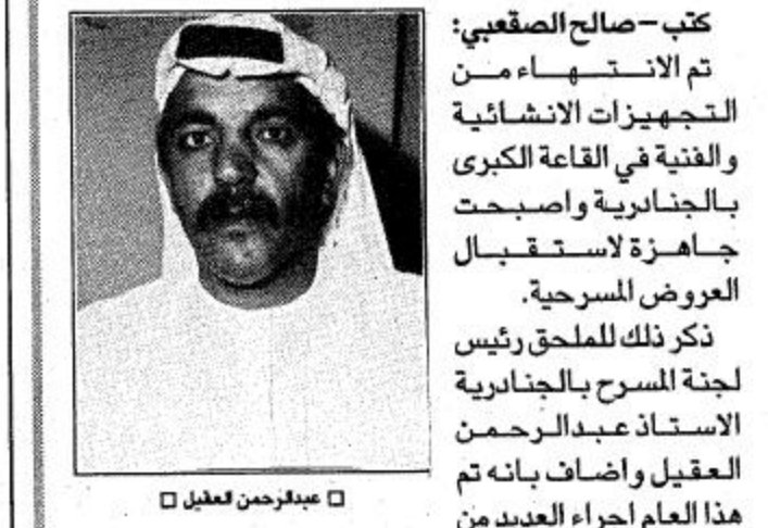
□ ميفر من معطل □