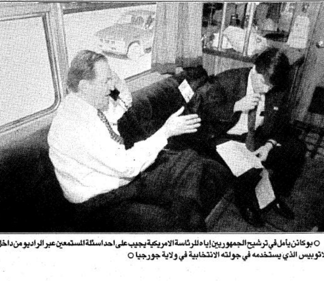
بوكانن يأمل في ترشيح الجمهوريين إياه للرئاسة الأمريكية تجيب على احد اسئلة المستمعين عبر الراديو من داخل الاوتوبس الذي يستخدمه في جولته الانتخابية في ولاية جورجيا