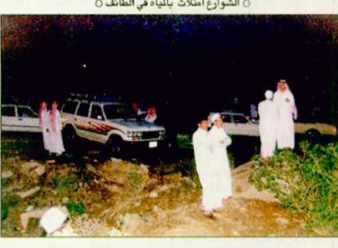
الامطار اجتزحت المنتزهين بالطائف تصوير محمد عمر

هطلت مساء أمس الأول الاثنين أمطار غزيرة على مكة المكرمة وضواحيها، حيث بدأ هطول الأمطار عند الساعة الخامسة عصراً وصحب الأمطار سقوط زخات من البرد بكثافة في بعض الأحياء والمناطق. وكانت النواحي الشمالية من مكة المكرمة أكثر مطولاً للأمطار مثل حي العمرة والنوابية والزاهر ومحافظة الجوج وبعض الهجر والقرى مثل الزبعا وغيرها من القرى المجاورة. وقد هبت عواصف هوائية شديدة قبل هطول الأمطار أدت إلى اقتلاع بعض الأشجار كما انقطع التيار الكهربائي عن بعض الأحياء بمكة المكرمة.