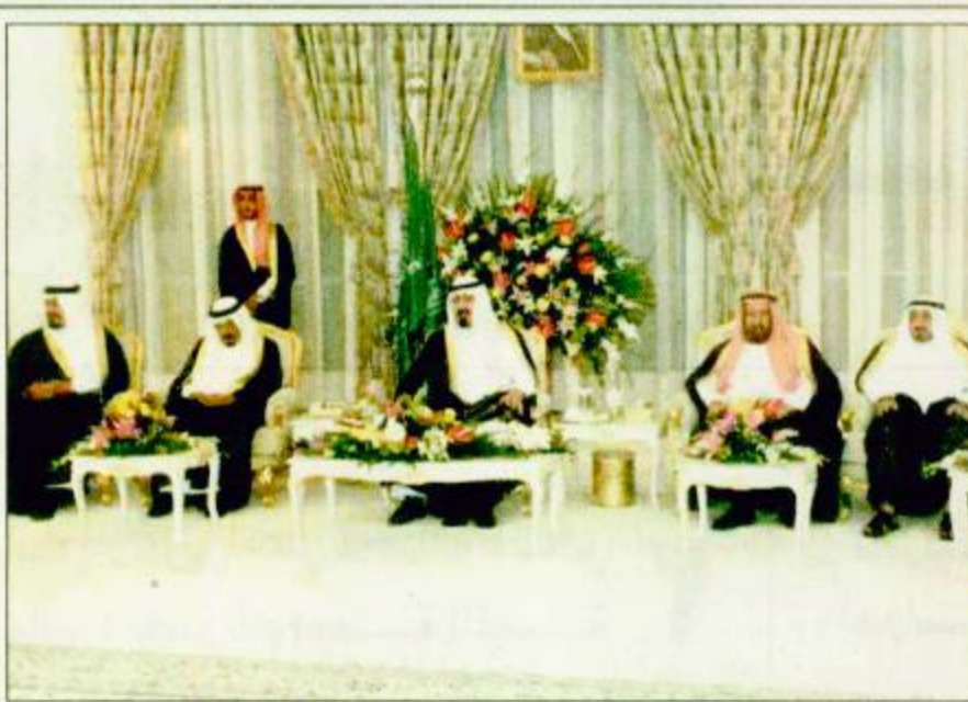
سمو ولي العهد لدى استقباله جموعاً من المواطنين

بناء على توجيهات القيادتين في المملكة العربية السعودية والجمهورية اليمنية وبناء على دعوة من صاحب السمو الملكي الأمير نايف بن عبدالعزيز وزير الداخلية بالمملكة العربية السعودية قام معالي اللواء حسين محمد عرب وزير الداخلية بالجمهورية اليمنية بزيارة للمملكة العربية السعودية يومي الاثنين والثلاثاء 22 و23/4/1421هـ الموافق 24 و25/7/2000م على رأس وفد يضم الجانب اليمني في اللجنة العسكرية المشتركة والجانب اليمني في الفريق الفني المشترك. وقد نقل معالي وزير الداخلية في الجمهورية اليمنية اللواء الركن حسين محمد عرب تحيات وتقدير فخامة الأخ الرئيس علي عبدالله صالح رئيس الجمهورية اليمنية لآخوانه خادم الحرمين الشريفين الملك فهد بن عبدالعزيز وصاحب السمو الملكي الأمير عبدالله بن عبدالعزيز ولي العهد نائب رئيس