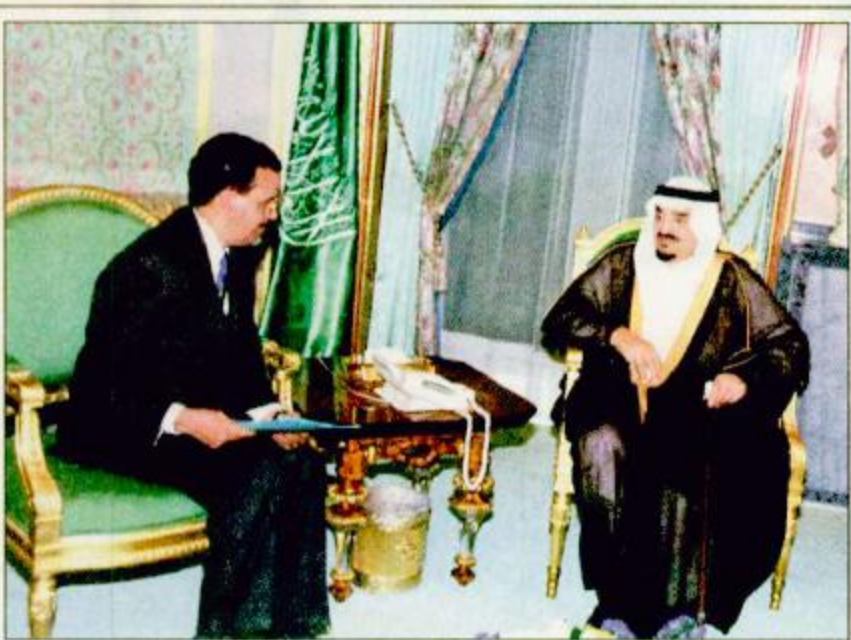
خادم الحرمين لدى استقباله وزير الاقتصاد الليباني