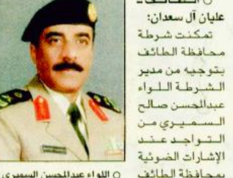
الطائف - عيان آل سعدان: تمكنت شرطة محافظة الطائف بتوجيه من مدير الشرطة اللواء عبدالجسار صالح السميري من التواجد عند الإشارات الضوئية بمحافظة الطائف في وقت قصير بعد انقطاع الكهرباء عن الطائف لأكثر من ساعتين.