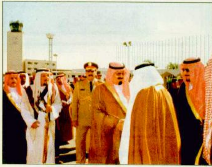
○ سموه خلال مغادرته الرياض متوجهاً إلى قطر ○