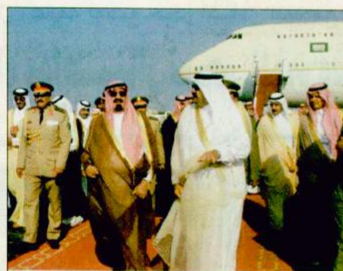
○ سمو ولي العهد لدى وصوله قطر ○