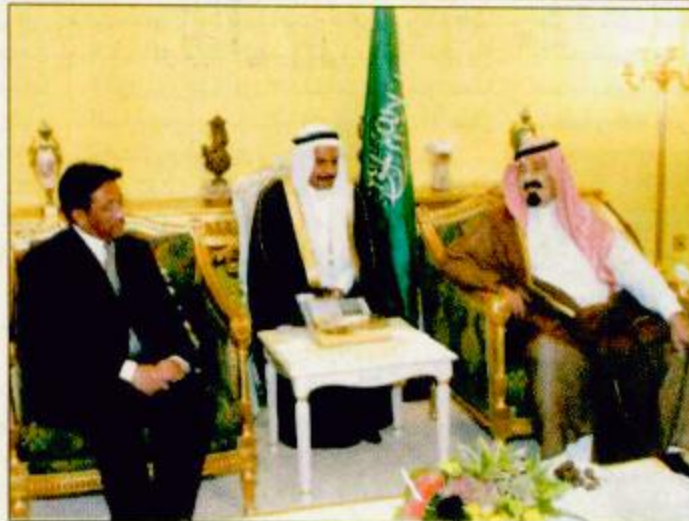
○ سمو ولي العهد يستقبل الرئيس عرفات وبرويز مشرف ○