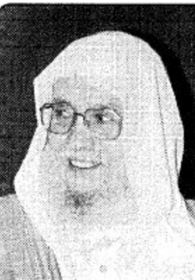
مكة المكرمة: سامي علي أكد معالي وزير الشؤون الإسلامية والأوقاف والدعوة والإرشاد الدكتور عبدالله بن عبدالحسن التركي ان جميع الاجهزة الحكومية في المملكة تبذل قصارى جهدها على امتداد تواجدها واستعداداتها لموسم الحج منذ وقت مبكر وذلك بمتابعة خادم الحرمين الشريفين الملك فهد بن عبدالعزيز وسمو ولي عهده الأمين - حفظهما الله -