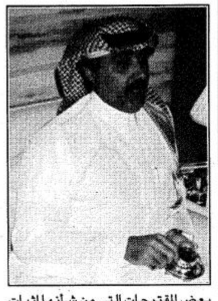
بعض اللقظات التي من شأنها اثبات تواجدنا الفعلي في المهرجان.

خلال استضافته السنوية المعتادة للمشاركين من الفنانين في اوبريت «عراس الملكة» الذي سيقدم مساء هذا اليوم على صالة الاحتفالات الرئيسية بالجنادرية أكد الأمير متعب بن عبدالله بن عبدالعزيز للصحفيين الذين حضروا مادية العشاء الخاصة مساء الاثنين الماضي ان المهرجان سيشهد في السنوات القادمة باذن الله تطورا جديدة حيث نحرض دائما ان يكون هناك جديد، كما اشار الى انه من المحتمل المشاركة النسائية بشكل فعال في تقديم أفكارهم وتعني ان يساهم العنصر النسائي في تقديم قصائد وطنية يمكن ان تكون هي الاوبريت في المرات القادمة، واعتبر سموه ان المرأة جزء من المجتمع وان لها دورا كبيرا واديبها والاحساس بالوطنية بشكل قد يفوق الرجال ولذلك وكما قال سمو الأمير متعب فإننا ندعو المرأة للمساهمة حتى في وضع