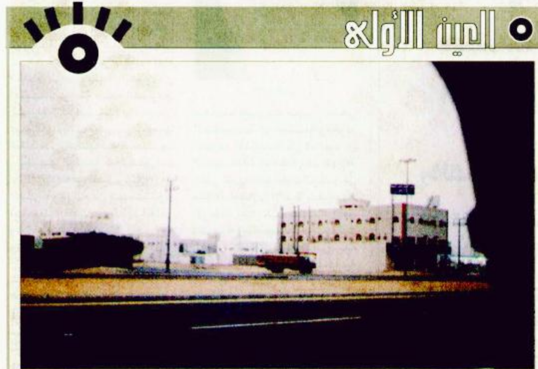
حومة بني تميم.. خطوات على طريق الازدهار الحضاري.. ولكن أما من مجسمات جمالية تضفي رونقاً على الصورة؟

صرح معالي وزير الصحة رئيس مجلس الضمان الصحي التعاوني الدكتور أسامة شبكشي بأن مجلس الضمان الصحي التعاوني عقد اجتماعاً له أمس السبت للرجعة النهائية لللائحة التنفيذية للنظام واعتماد ملاحظات هيئة الخبراء في مجلس الوزراء ضمن مواد اللائحة ليم بعد ذلك إصدار اللائحة بقرار من وزير الصحة. وأشار معالي الدكتور شبكشي إلى أن المجلس قام بدراسة موسعة ومستفيضة لإعداد هذه اللائحة وتمت الاستعانة في سبيل ذلك بخبرات متعددة من داخل وخارج المملكة واستمر المجلس بلجانته المختلفة في المراجعة الدقيقة لجمع مواد اللائحة وبما يتوافق مع الأهداف الأساسية للنظام وبما يظل مصلحة أطراف العلاقة التأمينية.