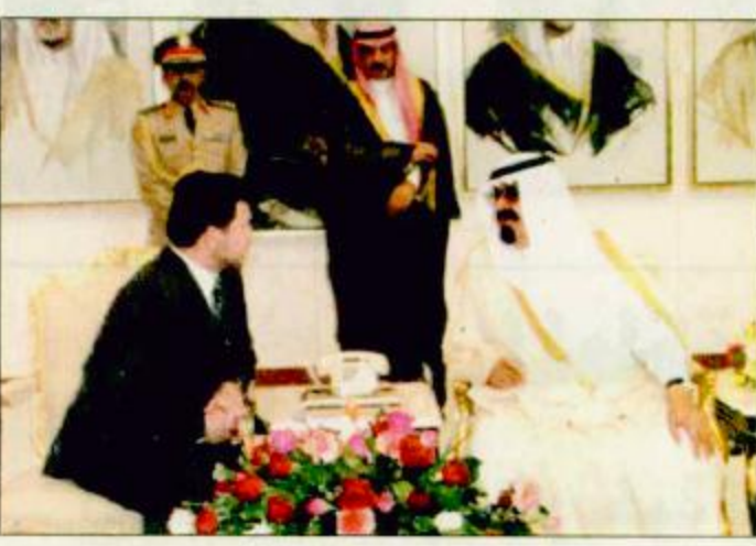
الأمير عبدالله لدى استقباله ملك الأردن / واس عقد صاحب السمو الملكي الأمير عبدالله بن عبدالعزيز ولي العهد ونائب رئيس مجلس الوزراء ورئيس الحرس الوطني وأخوه صاحب الجلالة الملك عبدالله الثاني بن الحسين ملك المملكة الأردنية الهاشمية اجتماعاً ثنائياً مغلقاً بقصر السلام في جدة أمس. وقد جرى خلال الاجتماع تبادل الأحاديث الودية وبمت العلاقات بين البلدين الشقيقين وسبل تعزيزها بما يكفل مصالحهما المشتركة. كما جرى استعراض شامل للأوضاع الراهنة في منطقة الشرق الأوسط وفي مقدمتها القضية الفلسطينية والارض والمحتلة إضافة إلى أبرز المستجدات على الساحتين العربية والإسلامية والدولية. وقد وصل صاحب الجلالة الملك عبدالله الثاني بن الحسين ملك المملكة الأردنية الهاشمية الشقيقة إلى جدة