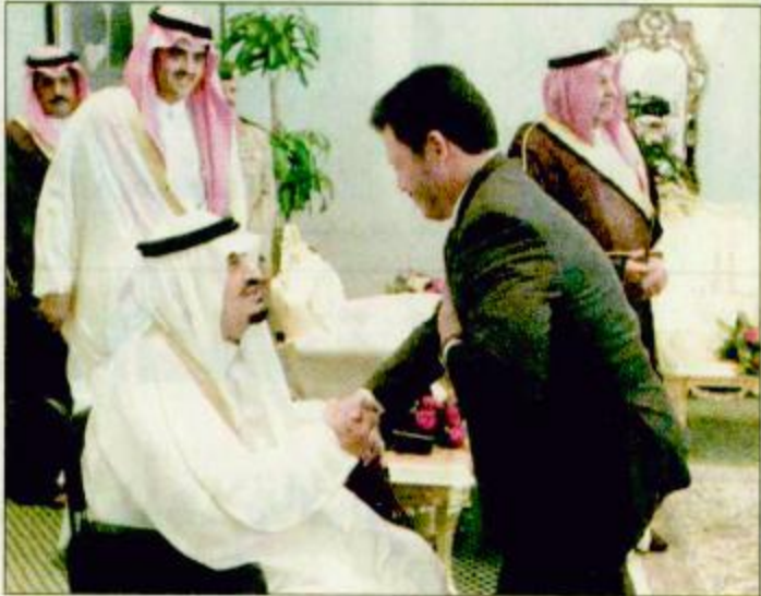
خادم الحرمين لدى استقباله الملك عبدالله / واس وصاحب السمو الملكي الأمير سعود وكييل الحرس الوطني القطيع عبدالعزیز بن عبدالعزیز أمير منطقة الغربی وصاحب السمو الملكي الدكتور بندر بن سلمان بن محمد آل سعود والاستشاري بدر بن سعود والأمير فيصل بن عبدالله بن محمد آل سعود

استقبل خادم الحرمين الشريفين الملك فهد بن عبدالعزيز آل سعود في قصر السلام أمس أخاه صاحب الجلالة الملك عبدالله الثاني بن الحسين ملك المملكة الأردنية الهاشمية والوفد المرافق له. وقد عقد خادم الحرمين الشريفين وأخوه صاحب الجلالة الملك عبدالله الثاني جلسة مباحثات رسمية في مكتبه بقصر السلام أمس. وحضر المباحثات من الجانب السعودي صاحب السمو الملكي الأمير عبدالله بن عبدالعزيز ولي العهد ونائب رئيس مجلس الوزراء ورئيس الحرس الوطني وصاحب السمو الملكي الأمير نايف بن عبدالعزيز وزير الداخلية وصاحب السمو الملكي الأمير سلمان بن عبدالعزيز أمير منطقة الرياض وصاحب السمو الملكي الأمير عبدالعزيز أمير منطقة الجوف.