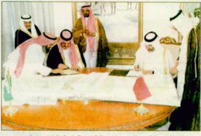
الأمير سعود الفيصل ووزير خارجية قطر يوقعان خرائط ترسيم الحدود / الدوحة - واس - ق.ن.أ. وقعت المملكة العربية السعودية ودولة قطر في الدوحة أمس على الخرائط النهائية لما تم إنجازه من رسم كامل الحدود البحرية وما تم تعيينه من خط الحدود البحرية بين البلدين. ووقع الخرائط عن المملكة صاحب السمو الملكي الأمير سعود الفيصل وزير الخارجية وقدمها عن الجانب القطري الشيخ حمد بن جاسم بن جبر آل ثاني وزير الخارجية. وأكد سمو الأمير سعود الفيصل والشخص حمد بن جاسم على العلاقات المتميزة وما يربط البلدين وشعبهما من علاقات أخوية وتاريخية. وحرصهما في أن تنسم هذه العلاقات على الدوام بالثمن والأخوة. وقال الأمير سعود الفيصل إنه بعد انتهاء القضايا الحدودية سيكون التعاون بشكل أفضل بينهما ويأمله