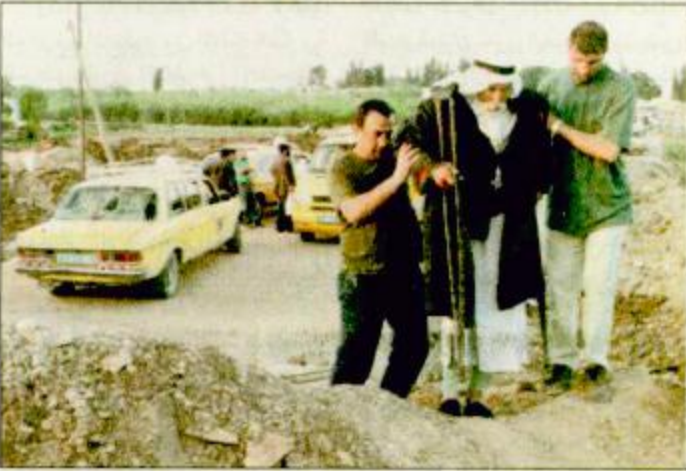
عوز فلسطيني يتلقى يد العون عند عبور رابية من الأحجار والتراب نصبها الاسرائيليون على الطريق بين قرى بيت لحم والخليل. / غزة - أ.ف.ب. رعت سبع دول يوم أمس مشروع قرار في مجلس الأمن يدعو لقوة مراقبين للأمم المتحدة لحماية الفلسطينيين في مسمى لاستصدار قرار بهذا الشأن قبل القمة العربية المزمع عقدها الأسبوع المقبل. والغرض من ذلك هو تكرار دعوة مجلس الأمن لإدلاء استعداده على أقل تقدير لارسال مراقبين غير مسلحين تابعين للأمم المتحدة للتحقق من سلامة وقطاع غزة حتى أذا عارضت إسرائيل دخولهم للضفة الغربية وقطاع غزة. ويعزب مشروع القرار عن تصديق مجلس الأمن «على انتهاك قوة مراقبين تابعة للأمم المتحدة من جيش وشروطه ونشرها في أنحاء الأراضي التي تحتلها إسرائيل منذ عام 1967». ورعت مشروع القرار سبع من الدول الأعضاء في المجلس تنتمي إلى