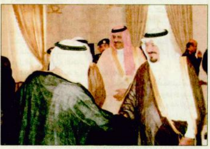
الأمير سلطان لدى استقباله قادة القوات المسلحة / الرياض - واس استقبل صاحب السمو الملكي الأمير سلطان بن عبدالعزيز النائب الثاني لرئيس مجلس الوزراء وزير الدفاع والطيران والمفتش العام في مكتبه أمس صاحب السمو الملكي الأمير خالد بن سلطان بن عبدالعزيز مساعد وزير الدفاع والطيران والمفتش العام للشؤون العسكرية ومعالي رئيس هيئة الأركان العامة الفريق أول ركن صالح بن علي المخيا وقادة القوات المسلحة ورؤساء الهيئات والإدارات في وزارة الدفاع والطيران.