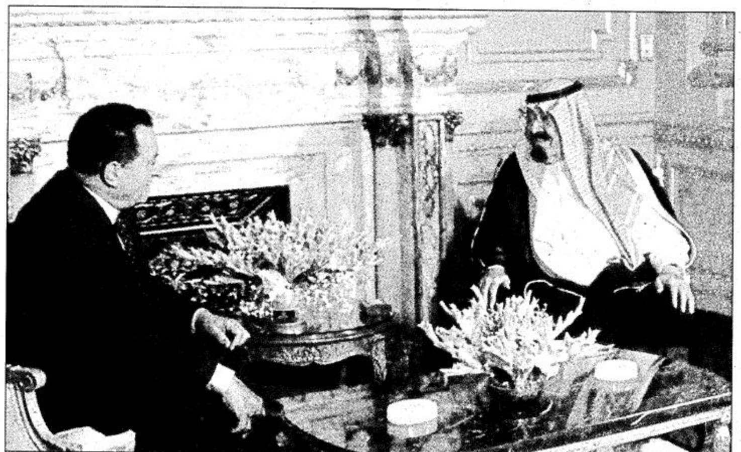
سمو ولي العهد اجري مباحثات ايجابية مع مبارك وعرفات

القاهرة - مكتب الجزيرة - عثمان نور - انصار زكي - ريم الحسين: