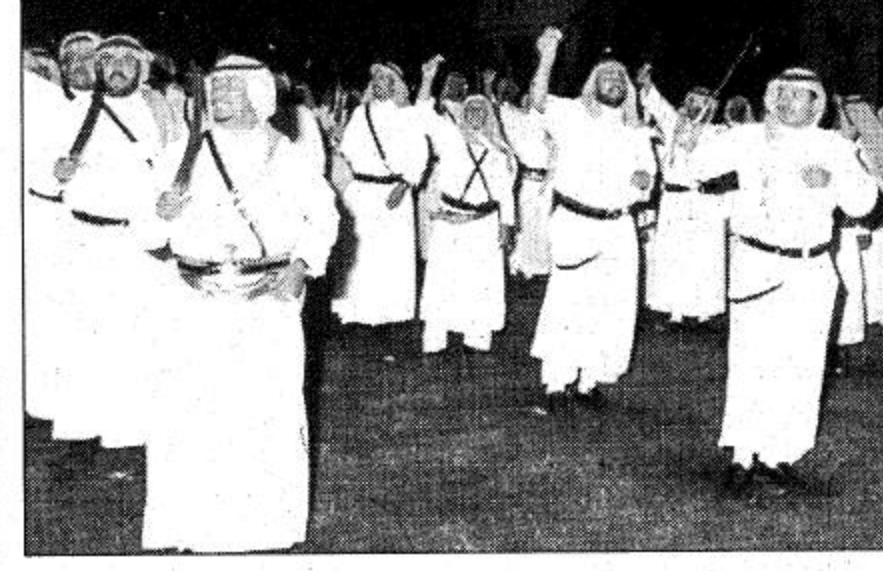
سموه زار أسرة آل شبيلي