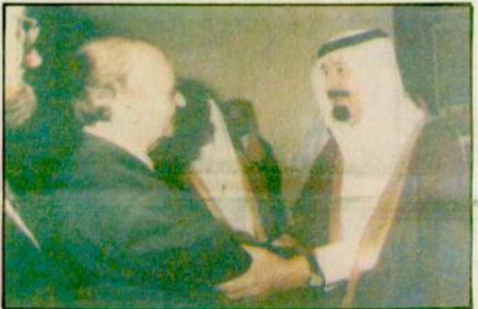
استقبل صاحب السمو الملكي الامير عبد الله بن عبد العزيز ولي العهد ونائب رئيس مجلس الوزراء ورئيس الحرس الوطني بكتب سموه في الديوان الملكي بصرى السلام بعد ظهر امس فضامة