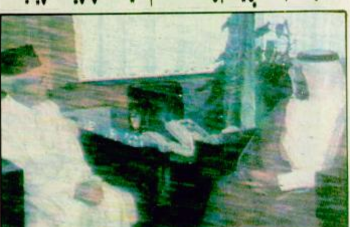
استقبل صاحب السمو الملكي الامير سلطان بن عبد العزيز النائب الثاني لرئيس مجلس الوزراء وزير الدفاع والطيران والمفتش العام بكتب سموه