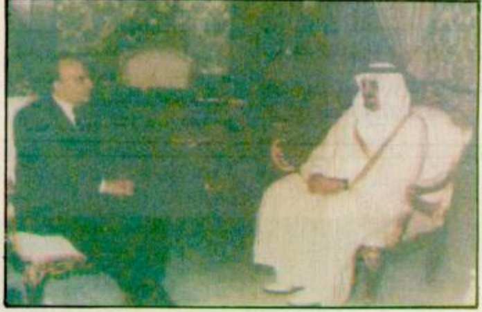
استقبل خادم الحرمين الشريفين الملك فهد بن عبد العزيز آل سعود - حفظه الله - في مكتبه امس فضامة الرئيس علي عزت بيجوفيتش رئيس جمهورية البوسنة والهرسك ودولة نائب الرئيس الدكتور ايوب غانيتش والوفد المرافق لهما.