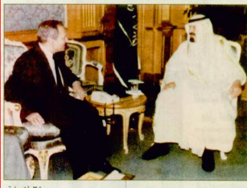
« صورة تليفزيونية » « التفاصيل ص 33 البقية ص 33 »

الشرع: ما تشهده المملكة من تطور إنجاز لكل العرب والمسلمين ويحز في نفوسنا ان يلحق أي أذى او ضرر بأمنها