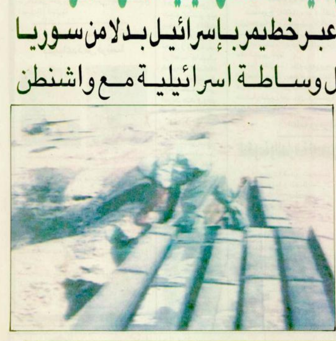
البحيرة - القاهرة