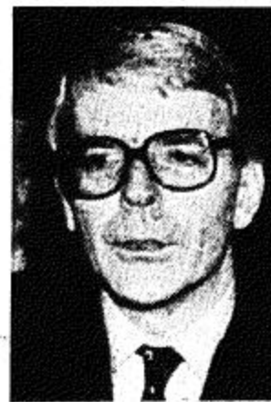
مع الجيش الجمهوري الأيرلندي مطبق العام الجاري. وهي أول مرة تعترف فيها الحكومة

لندن ١٦ أ. ف. ب. أكد وزير الخارجية الأيرلندي ديك سبرينغ أمس أن القبة البريطانية الأيرلندية المقلدة مستعد على الأرجح مطبخ كسانون الأول/ديسمبر المقبل في دبلن. وكانت الحكومة البريطانية قد أعلنت الإبقاء على المخفي أن أي موعده لم يحدد رسمياً. القبة البريطانية الأيرلندية حول أيرلندا الشمالية مما يعزدي شائعات تحدثت عن إرجاء هذا اللقاء الذي كان مقرراً أصلاً في الثالث من الشهر المقبل. ونفى سبرينغ أن تكون القبة قد تاجلت. وقال إن الموعد المقرر كان بداية كانون الأول/ديسمبر ولكن مثل العادة لكي يجتمع رجال مشغولان جداً أي رئيساً ووزيراً بريطانيا وأيرلندا، يحتاج الأمر إلى بعض المرونة. وأشار سبرينغ إلى إمكانية توصيل الطرفين في تسوية النزاع أيرلندا الشمالية بين الجمهوريين الكاثوليك والوحدويين البروتستانت. وقد وجه زعماء هذين الحزبين يوم السبت دعوات متناقضة إلى رئيس الوزراء البريطاني جون ميجور لحل الأزمة في أيرلندا الشمالية. فبينما طالب الحزب الديمقراطي السويدي «سيرستانت» بمحاكمة السلطات الأيرلندية وما الحزب الاجتماعي الديمقراطي والعمالي كاثوليك، لندن إلى العمل مع الحكومة الأيرلندية التي تصل إلى اتفاقات سلام. من ناحية أخرى اعترفت الحكومة البريطانية لأول مرة بأنها تبادلت رسائل مع الجيش الجمهوري الأيرلندي المتمرد في كانون الأول/ديسمبر.