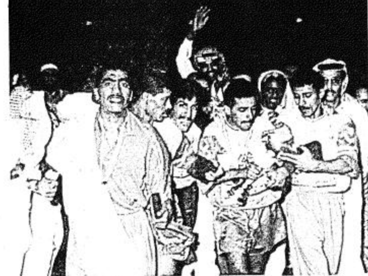
شبابية وقد انكشف لدى الجميع ان المساراة ستؤول الى التعادل إلا في حالة استثمار احد الفريقين لواحدة