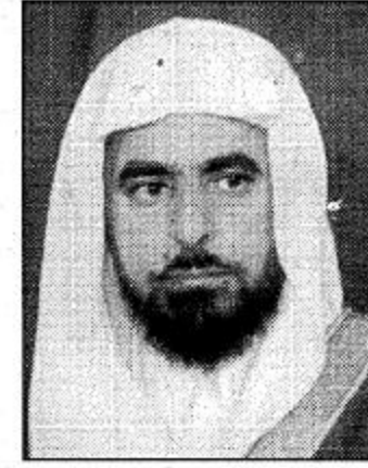
مندوب تعليم البنات بالحريق

الحريق-زيد علي العيد: عبر عدد من المسؤولين والأعيان في محافظة الحريق عن اعتزازهم وسعادتهم البالغة، بالزيارة المرثبة لصاحب السمو الملكي الأمير عبدالله بن عبدالعزيز ولي العهد نائب رئيس مجلس الوزراء ورئيس الحرس الوطني الى المحافظة. وأكدوا في تصريحات لـ«الجزيرة» ان هذه الزيارة اليمونة هي امتداد لعطاءات الخير وجولاته المباركة على النجرات ومتابعة للمشروعات التنموية التي تحققت لمناطق ومحافظة الملكة المختلفة في ظل رعاية حكومة خادم الحرمين الشريفين. وقالوا ان الحريق قد لبست أبهى حللها ابتهاجا بالزيارة القادمة لسمو ولي العهد الامين