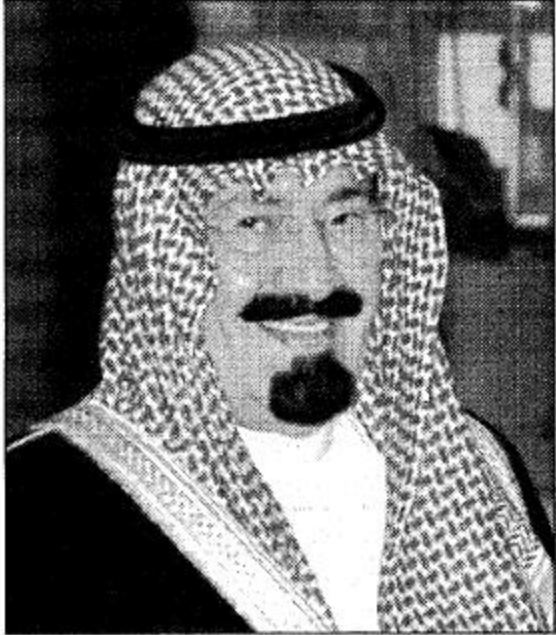
سمو ولي العهد