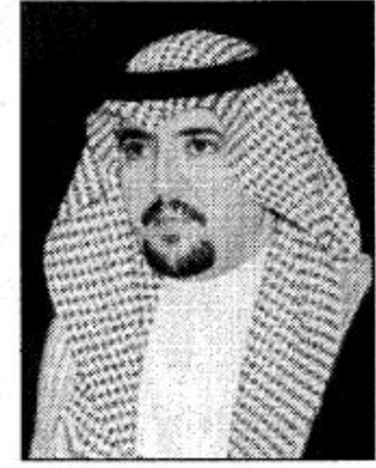
رئيس بلدية الحريق