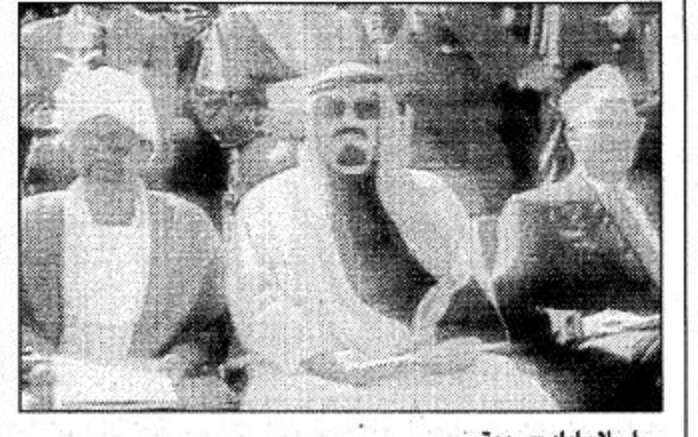
اسلام اباد - رويتر.

شاهد زعماء العالم الإسلامي أمس الأحد عرضاً عسكرياً مر في شوارع العاصمة اسلام اباد قبل ان يبدأوا اجتماع قمة خاصاً لمدة يوم واحد للاحتفال باليوبيل الذهبي لاستقلال باكستان. ووصل الرئيس الباكستاني فاروق ليغاري الى المنصة التي تابع من فوقها العرض العسكري في عربة تجرها الخيول وقال في خطابه «يشرفنا مجيء قادة الدول الإسلامية من شتى انحاء العالم للاشتراك في الاحتفال بمرور خمسين عاماً على استقلالنا. ودعوا الله ان تظل الأمة الإسلامية موحدة». وقال ليغاري ان الثالث والعشرين من مارس اذار هو نقطة تحول في تاريخ باكستان لانه جسد اعلان عام 1940 الذي دعا لاقامة وطن مستقل للمسلمين في شبه القارة الهندية. وتستهدف قمة منظمة المؤتمر الإسلامي التي تضم 54 دولة التأكيد على التضامن الدولي مع باكستان التي استقلت عن بريطانيا عام 1947. وقال انعام الحق المتحدث الباكستاني خلال مؤتمر صحفي ان جدول اعمال القمة سيركز على نقطة واحدة هي اعداء العالم الإسلامي للقرن الحادي والعشرين وسيشير اعلان القمة الى المشاكل التي تواجه العالم الإسلامي في المجال السياسي والاقتصادي والمجالات الأخرى وطرق التغلب عليها. وقال ان تلك المشاكل تتضمن «العنوان الثقافي» الذي تشهه وسائل الاعلام الأمريكية على الدول الإسلامية كما سيرصد الاعلان القضية الفلسطينية وتزاع باكستان مع الهند حول كشمير.