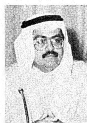
يسالطون الفني مع مركز التجارة الدولية ومنظمة الابتكاد... وتبلغ تكلفة تنفيذ المشروع حوالي مليوني دولار تمول مناصفة بين برنامج تمويل التجارة العربية وبرنامج الأمم المتحدة الإنمائي.

ابوظبي: ق. ن. ا: وضع برنامج تمويل التجارة العربية ومقره ابوظبي خطة سريعة لربط المركز الرئيسي لشبكة معلومات التجارة العربية بمقره بباوظبي بعدد محدود من نقاط الارتباط المختارة في الدول العربية والتي لها القدرة الفنية والتقنية للربط مع المركز الرئيسي للشبكة في المرحلة الراهنة.