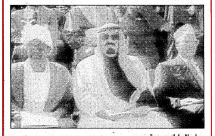
اسلام اباد - رويترز.

شاهد زعماء العالم الاسلامي امس الاحد عرضا عسكريا مر في شوارع العاصمة اسلام اباد قبل ان يبدأوا اجتماع قمة خاصا لمدة يوم واحد للاحتفال باليوبيل الذهبي لاستقلال باكستان.