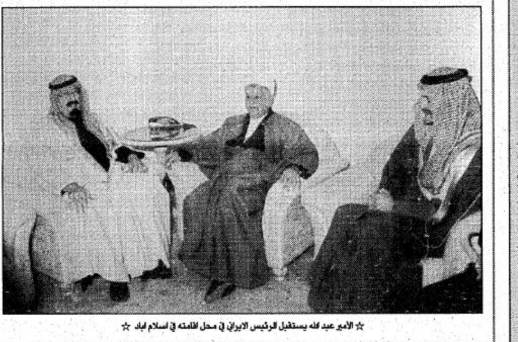
الامير عبد الله يستقبل الرئيس الإيراني في محل لقائه في اسلام اباد.

وقد سبق انعقاد القمة الاسلامية الاستثنائية امس تطورات ذات وجهين عربي واسلامي في ارض فلسطين الفصصية والاراضي المحتلة الاخرى (الضفة الغربية لنهر الاردن) بسبب سياسات الحكومة الاسرائيلية بقيادة بنيامين نتانياهو المناهضة لعملية السلام.