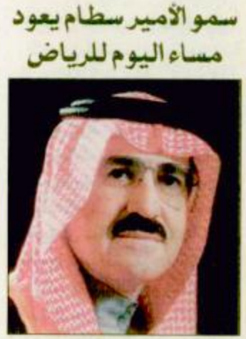
سمو الأمير سلطان يعوّد مساء اليوم للرياض

المنامة - الدوحة - الكويت - واس - ق.ن.: وصف وزير الخارجية البحريني محمد بن مبارك آل خليفة اجتماع اللجنة الوزائية الرباعية بأنه كان إيجابياً حيث نظرت اللجنة في تطورات العلاقات بين دولتي البحرين وقطر في ضوء الخلاف القائم بين البلدين الشقيقين. وقال في تصريح لوكالة انباء الخليج عقب عودته من الرياض الليلة قبل الماضية ان اللجنة اجرت مشاورات مفصلة حول مشروع مذكرة التفاهم بشأن أفكار محددة حول أسلوب العمل لحل اي خلاف ينشأ بين دول مجلس التعاون لدول الخليج العربية مشيراً الى انه تقرر ان تعقد اللجنة اجتماعها الثاني يوم الاحد القادم ان شاء الله. ومن ناحيته قال وزير الخارجية القطري الشيخ حمد بن جاسم بن جبر آل ثاني ان اجتماع اللجنة الوزائية الرباعية لتنقية الاجواء بين قطر والبحرين بحث جميع نقاط الخلاف بين قطر والبحرين بالإضافة الى البقية «ص27»