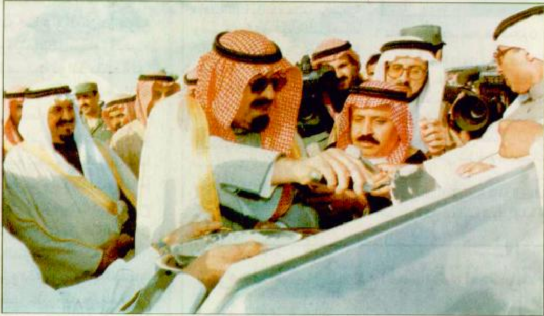
سمو ولي العهد يضع حجر الأساس لمركز الملك عبدالعزيز الطبي