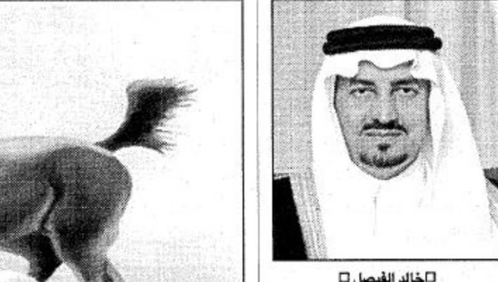
○ لخالد الفيصل