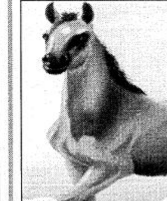
○ لخالد الفيصل

وأشاره. وتمتع ورشاً. لذلك يقول: إنك الوحيد الذي العبث منك محمود ولن اضيف اجمل مما قاله الأمير الشاعر/ خالد الفيصل في جمال الخيل حين قال: زين ودلال وعقوان ورويه طوع وعصى تتقاد لو كان بك زود موج المعارف والتشليل وسويبه يبرق معزه فوق الأعناق مفرد احسب ركب الخيل واعشق خبيبه فوق النقر والحر والصفير والسود والخيل والفروسية. عتب كبير على الأمير الشاعر/ في انه غير متواجد في سباقات الفروسية وهو من مشاهير الأوائل. او حتى الحضور لبيد ان السباق. ومن منطلق عشقه للخيول والفروسية فإن أكثر أبناء منطقة عسير بالطبع يتطلعون إلى إيجاد ناد للفروسية في منطقتهم لانه لا نقص لديهم إلا في هذه الناحية. ما رأي الأمير لو تحققت هذه الأمنية الفروسية؟