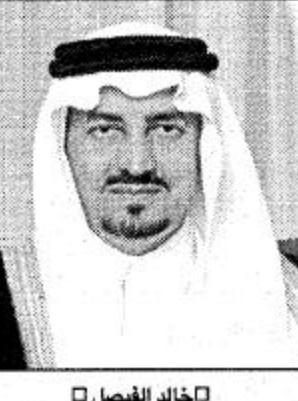
○ لخالد الفيصل

وأشاره. وتمتع ورشاً. لذلك يقول: إنك الوحيد الذي العبث منك محمود ولن اضيف اجمل مما قاله الأمير الشاعر/ خالد الفيصل في جمال الخيل حين قال: زين ودلال وعقوان ورويه طوع وعصى تتقاد لو كان بك زود موج المعارف والتشليل وسويبه يبرق معزه فوق الأعناق مفرد احسب ركب الخيل واعشق خبيبه فوق النقر والحر والصفير والسود والخيل والفروسية. عتب كبير على الأمير الشاعر/ في انه غير متواجد في سباقات الفروسية وهو من مشاهير الأوائل. او حتى الحضور لبيد ان السباق. ومن منطلق عشقه للخيول والفروسية فإن أكثر أبناء منطقة عسير بالطبع يتطلعون إلى إيجاد ناد للفروسية في منطقتهم لانه لا نقص لديهم إلا في هذه الناحية. ما رأي الأمير لو تحققت هذه الأمنية الفروسية؟