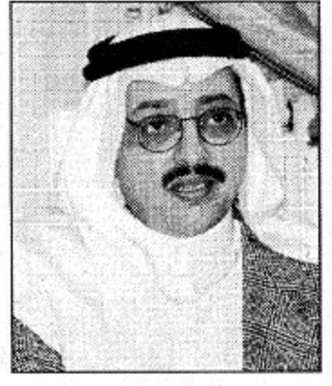
فيصل بن خالد

خروج صاحب السمو الملكي الأمير فيصل بن خالد بن عبدالعزيز من مستشفى «أندرسون» بولاية هيوستن بأمريكا بعد نجاح الفحوصات الطبية ولله الحمد وذلك مساء أمس الخميس.. الحمد لله على السلامة أبا خالد وبانتظار عودة الأمير المحبوب إن شاء الله إلى أرض الوطن. ذكر ذلك للميدان سعد مشرف الحظطاني في اتصال هاتفي معه.