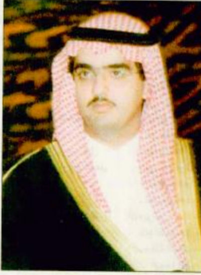
○ الأمير عبدالعزيز بن فهد بن عبدالعزيز