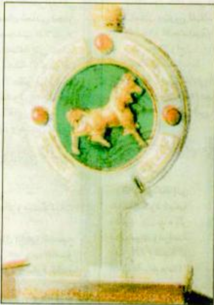
○ كأس المستورد

○ كأس العام الماضي حظي شوط الانتاج بـ 16 جواداً بينما حظي شوط المستورد في ذلك العام بـ 10 رؤوس، وفي هذا العام انعكست الامور ○ اعتقدو الله اعلم ان الخيال المتعدد على الاجواء هو مفتاح الخطة الذهبية متى ما نفذها بحذافيرها وليس شرطاً! ○ ادوار البسميكر في هذا الشوط مؤثرة بيد ان جياد المساندة الثانية اكثر تأثيراً! ○ هل يطير الكاس لـ دبي، ام يكون لنجوم الأزرق والاخضراني والعنابي والابيضاني.. رأي ناري ثلث ○ جمران صاحب الرقم القياسي لهذه المسافة وتحطيم صعب جدا والمعنى في بطن «6» جياد تشارك لأول مرة! ○