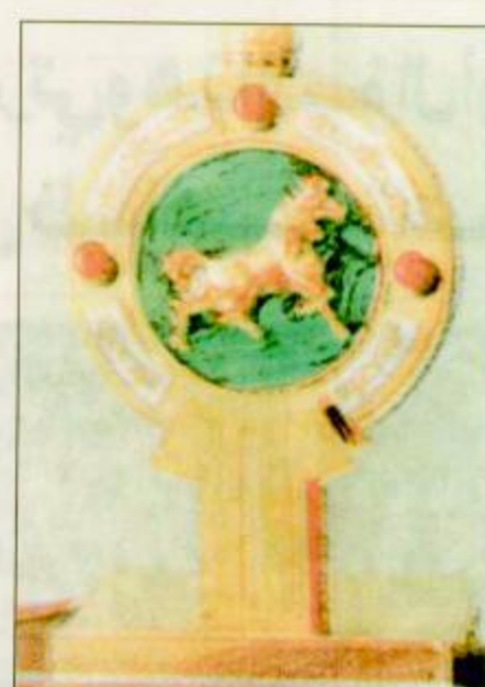
○ كأس الإنتاج

لجياد المستورد حظيت بمشاركة 19 جواداً بعد انسحاب البطل جمران الأبرز من هذا السباق ويشارك فيه سيدون، وميهج، وضار من الاسطبل الأزرق، والاجزل، وميراد والمسترة، والسوط والقاصد من الاسطبل الابيض، وسلطان العز والجاسر، وماهان وحديان من الاسطبل العنابي بينما يشارك من الاسطبل الاخضراني كل من فوزان وفواز ومنصور وسناني ومناوي ويشارك رائد للكتوم بجواذيه اسكان وبوزاريكا. وينظر لهذه الاسماء وهذه التركيبة الكبيرة من هذه الجياد التي تشارك في هذا الشوط نجد ان