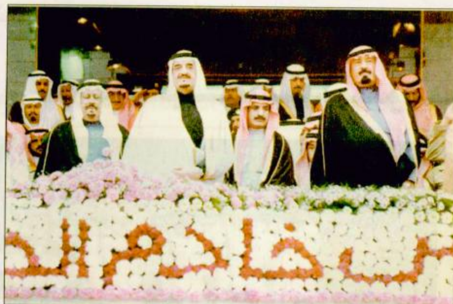
○ خادم الحرمين الشريفين سمو ولي العهد في إحدى مناسبات الفروسية