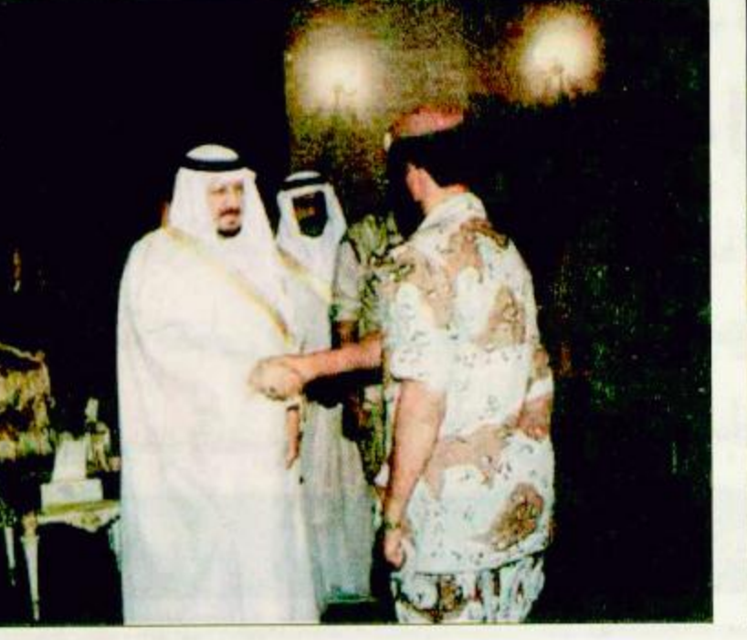
منى - واصل: استقبال صاحب السمو الملكي الأمير عبدالرحمن بن عبدالعزيز نائب رئيس مجلس الوزراء ورئيس الحرس الوطني ومعه سموه الكريم للموقع الذي يمسؤول وضباط الحرس الوطني الموجودين على رأس العمل في المشاعر المقدسة والتي كذلك ببعض المواطنين وهذا الجميع بعد الانتهاء المبارك.