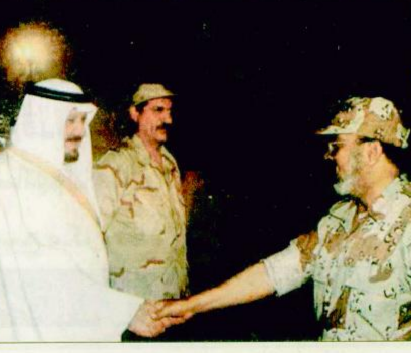
منى - واصل: استقبال صاحب السمو الملكي الأمير عبدالرحمن بن عبدالعزيز نائب رئيس مجلس الوزراء ورئيس الحرس الوطني ومعه سموه الكريم للموقع الذي يمسؤول وضباط الحرس الوطني الموجودين على رأس العمل في المشاعر المقدسة والتي كذلك ببعض المواطنين وهذا الجميع بعد الانتهاء المبارك.

منى - واصل: استقبال صاحب السمو الملكي الأمير عبدالرحمن بن عبدالعزيز نائب رئيس مجلس الوزراء ورئيس الحرس الوطني ومعه سموه الكريم للموقع الذي يمسؤول وضباط الحرس الوطني الموجودين على رأس العمل في المشاعر المقدسة والتي كذلك ببعض المواطنين وهذا الجميع بعد الانتهاء المبارك. ثم قام سموه بجولة على الخيام الجديدة للحرس الوطني في منى والتي تتكون من طورتين وهي عبارة عن دراسة أعدت من قبل إدارة المشاريع بالحرس الوطني والقطاع الغربي المصنوعة من مادة السبند والفايبر جلاس المقاومة للحريق. بعد ذلك توجه سموه الكريم لزيارة جهاز الإشراف والتوجيه بالحرس الوطني حيث كان في استقباله د. إبراهيم بن محمد أبو عبيدة رئيس جهاز الإشراف والتوجيه بالحرس الوطني. بعد ذلك زار سموه الكريم مستشفى الحرس الوطني بمنى حيث تفقد أقسام المستشفى الداخلية والعيادات الخارجية كما اطلع على النظام الإلكتروني الجديد المتطور الذي يربط مستشفى الحرس الوطني بمنى بكل من مستشفى الملك فهد للحرس الوطني بالرياض ومستشفى الملك خالد للحرس الوطني بجدة من طريق الأقمار الصناعية، عرب سات، كما اطمأن سموه خلال الزيارة على الرضى