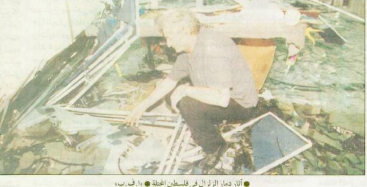
آثار دمار الزلزال في فلسطين المحتلة

الرياض - محمد الوكيل - القاهرة - بيروت - عمان - مراسلو الجزيرة - الوكالات: الملك فهد بن عبدالعزيز آل سعود رئيس مجلس الوزراء ورئيس مجلس التعليم العالي يحفظه الله بالوفاة على قرارات مجلس التعليم العالي التي اتخذها في جلسته الثانية التي عقدت بتاريخ 11/6/1416هـ وذلك اهتماماً منه - يحفظه الله - بالجامعات ومنسوبيها وحرصه على توفير أفضل السبل التعليمية والتربوية الرياض - واس: تفضل خادم الحرمين الشريفين الملك فهد بن عبدالعزيز آل سعود رئيس مجلس الوزراء ورئيس مجلس التعليم العالي يحفظه الله بالوفاة على قرارات مجلس التعليم العالي التي اتخذها في جلسته الثانية التي عقدت بتاريخ 11/6/1416هـ وذلك اهتماماً منه - يحفظه الله - بالجامعات ومنسوبيها وحرصه على توفير أفضل السبل التعليمية والتربوية الرياض - واس: استقبل صاحب السمو الملكي الأمير عبد الله بن عبد العزيز ولي العهد نائب رئيس مجلس الوزراء ورئيس الحرس الوطني في مكتب سموه برئاسة الحرس الوطني أمس جموعاً من المواطنين الذين قدموا للسلام على سموه الرياض - واس: استقبل صاحب السمو الملكي الأمير عبد الله بن عبد العزيز ولي العهد نائب رئيس مجلس الوزراء ورئيس الحرس الوطني في مكتب سموه برئاسة الحرس الوطني أمس جموعاً من المواطنين الذين قدموا للسلام على سموه الرياض - واس: استقبل صاحب السمو الملكي الأمير عبد الله بن عبد العزيز ولي العهد نائب رئيس مجلس الوزراء ورئيس الحرس الوطني في مكتب سموه برئاسة الحرس الوطني أمس جموعاً من المواطنين الذين قدموا للسلام على سموه