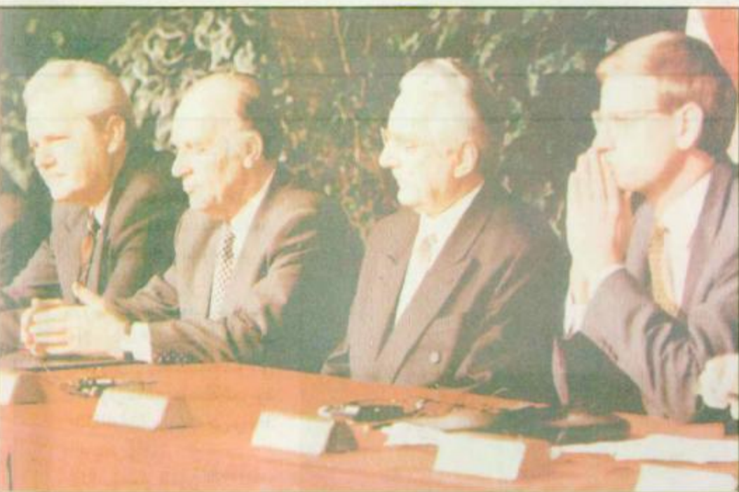
قاعة رايت باترسون الجوية، أوهايو، الولايات المتحدة: الرئيس المصري سوليودان ميلوسيفيتش «يسار»، والرئيس البوسني علي عزت بيجوفيتش «الثاني من اليسار»، والرئيس الكرواتي فرانسو توجمان «الثاني من اليمين»، واللغوض الخاص للاتحاد الأوروبي كارل بلديت «يمين، ينتظرون التوقيع بالاحرف الأولى على اتفاق السلام في قاعة رايت - باترسون الجوية بالقرب من دايتون بأوهايو

الرياض - محمد الوكيل - القاهرة - بيروت - عمان - مراسلو الجزيرة - الوكالات: الملك فهد بن عبدالعزيز آل سعود رئيس مجلس الوزراء ورئيس مجلس التعليم العالي يحفظه الله بالوفاة على قرارات مجلس التعليم العالي التي اتخذها في جلسته الثانية التي عقدت بتاريخ 11/6/1416هـ وذلك اهتماماً منه - يحفظه الله - بالجامعات ومنسوبيها وحرصه على توفير أفضل السبل التعليمية والتربوية الرياض - واس: تفضل خادم الحرمين الشريفين الملك فهد بن عبدالعزيز آل سعود رئيس مجلس الوزراء ورئيس مجلس التعليم العالي يحفظه الله بالوفاة على قرارات مجلس التعليم العالي التي اتخذها في جلسته الثانية التي عقدت بتاريخ 11/6/1416هـ وذلك اهتماماً منه - يحفظه الله - بالجامعات ومنسوبيها وحرصه على توفير أفضل السبل التعليمية والتربوية الرياض - واس: استقبل صاحب السمو الملكي الأمير عبد الله بن عبد العزيز ولي العهد نائب رئيس مجلس الوزراء ورئيس الحرس الوطني في مكتب سموه برئاسة الحرس الوطني أمس جموعاً من المواطنين الذين قدموا للسلام على سموه الرياض - واس: استقبل صاحب السمو الملكي الأمير عبد الله بن عبد العزيز ولي العهد نائب رئيس مجلس الوزراء ورئيس الحرس الوطني في مكتب سموه برئاسة الحرس الوطني أمس جموعاً من المواطنين الذين قدموا للسلام على سموه الرياض - واس: استقبل صاحب السمو الملكي الأمير عبد الله بن عبد العزيز ولي العهد نائب رئيس مجلس الوزراء ورئيس الحرس الوطني في مكتب سموه برئاسة الحرس الوطني أمس جموعاً من المواطنين الذين قدموا للسلام على سموه