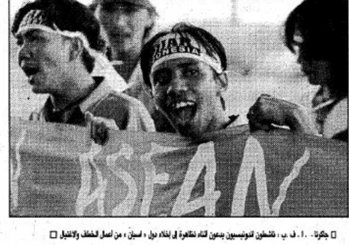
بكرة - ف. ب. - نشطاء اندونيسيون يمين الله تطهير في بلدة بول، اسين، من أصل لفظ لاقيل

جاكرتا - رويترز، نقلت صحيفة جاكرتا بوست عن وزير العدل الاندونيسي مولاي قوله امس الاربعاء ان الحكومة تعتزم اطلاق سراح ما بين ٧٥ الى ١٠٠ سجين سياسي بمناسبة يوم الاستقلال في اسبوع الامم المتحدة. وقال مولاي ان هؤلاء السجناء سيجرح عنهم «الاسباب الانسانية» وان معظمهم من الستين وبعدهم تورط في انقلاب فشل عام ١٩٦٥ القيت مسؤوليته على الحزب الشيوعي الاندونيسي. ونقلت الصحيفة عن مولاي قوله في مدينة بوجيبارتا «معظمهم ممن تزيد اعمارهم عن ٧٠ عاما ومنهم قضاوا احكاما بالسجن تزيد على ٣٠ عاما». وقتل مئات الاف من الأشخاص في حملات تطهير ضد الشيوعيين بعد محاولة الانقلاب. وتم تول سوارتو الذي كان جنرالا بالجيش المسلمة. وحكم سوارتو اندونيسيا ٢٧ عاما واستقال في الحادي والعشرين من مايو ايار الماضي وسط اضطرابات متزايدة لارتباطها ازمة اقتصادية خلقت وخلفه الرئيس يوسف حبيبي. وبعد تولي حبيبي السلطة اطلق سراح ٧٢ سجيناً سياسياً بينهم الزعيم العمالي البارز مختار باكيهان والمعارض اليساري سري بديانتج ومولتوس. وكان الاثنان من أبرز المعتدلين في سوارتو.