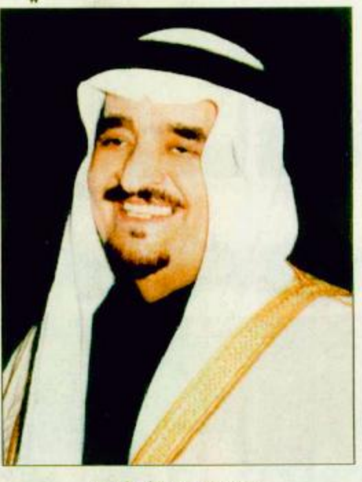
○ خادم الحرمين الشريفين

تسليم التمور التي أمر بها الملك لتوزيعها لمسلمي سريلانكا خادم الحرمين يهنئ، رئيسي الجزائر وبولندا ويتلقى شكر شبكسي الرياض-واس: بعث خادم الحرمين الشريفين الملك فهد بن عبدالعزيز آل سعود برفقة تهنية لأخيه فخامة الرئيس عبد العزيز بوتفليقة رئيس الدولة بالجمهورية الجزائرية الديمقراطية الشعبية بمناسبة ذكرى اليوم الوطني لبلادها. وأعرب الملك المفدى باسمه وأسم شعب وحكومة المملكة العربية السعودية عن أطيب التهاني القلبية وأصدق التمنيات الأخوية بموفور الصحة والسعادة لفخامته والتقدم والأزهار لشعب الجزائر الشقيق. كما بعث خادم الحرمين الشريفين الملك فهد بن عبدالعزيز آل سعود حفظه الله برفقة تهنية لفخامة الرئيس الكسندر كانستفيسكي رئيس جمهورية بولندا بمناسبة إعادة انتخابه رئيساً لجمهورية بولندا. وأعرب الملك المفدى عن أطيب التهاني مقرونة بتمنيات لفخامة الصحة والتوفيق في مسؤولياته تجاه شعب بولندا الصديق. من جهة أخرى أقيم أمس في العاصمة السريلانكية كولمبو احتفال تم فيه تسليم التمور التي أمر بها خادم الحرمين الشريفين الملك فهد بن عبدالعزيز آل سعود لتوزيعها على المسلمين في سريلانكا خلال شهر رمضان المبارك القادم وذلك بعكبت وزير التجارة ووزير البقية» ص ٢٣.