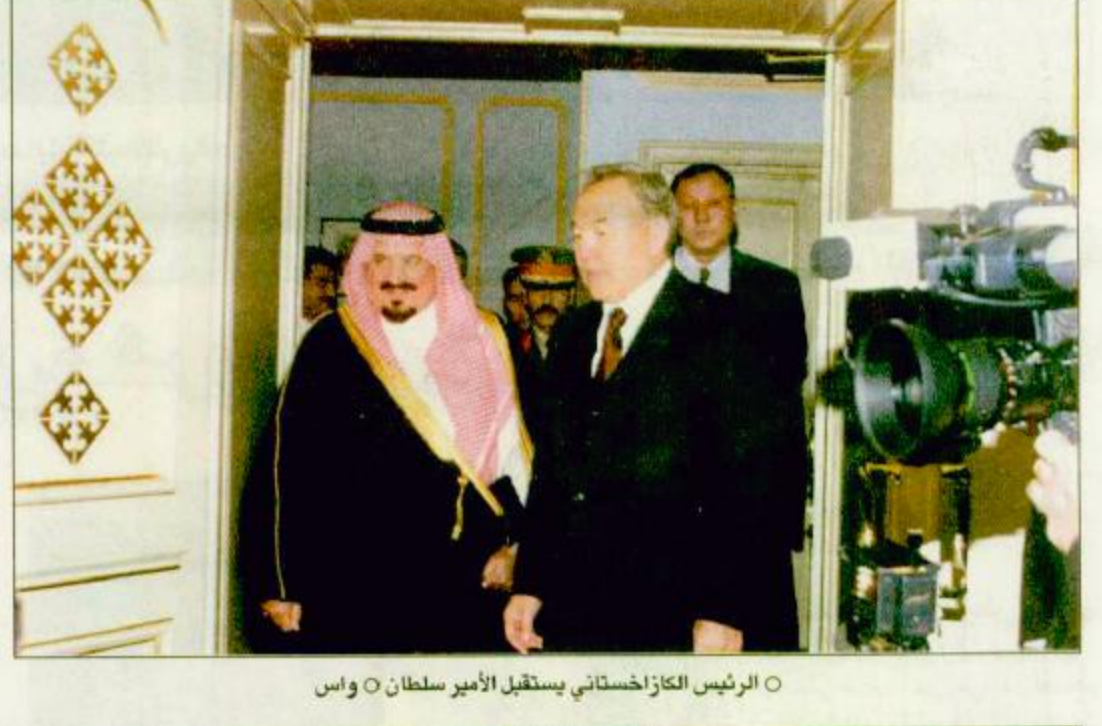
○ الرئيس الكازاخستاني يستقبل الأمير سلطان ○ واس

اتفاقية لتشييد طريق جوي بكازاخستان وبناء البرلمان الجديد استانا-تشرين: أكد صاحب السمو الملكي الأمير سلطان بن عبدالعزيز النائب الثاني لرئيس مجلس الوزراء وزير الدفاع والطيران والمفتش العام أن المملكة العربية السعودية مستعدة للتعاون مع كل دولة إسلامية تريد التعاون معها. وقال سموه في لقاء صحفي عقده يوم أمس مع رئيس جمهورية كازاخستان نور سلطان نزار بايبيف عقب جلسة المباحثات الرسمية بين المملكة وكازاخستان، نحن فاثقون الأبواب والقلوب لكل مسلم بإمكاننا أن نتعاون معاً أو نساعد. ودعا سمو الأمير سلطان رجال الأعمال السعوديين إلى التعاون مع اخوانهم وزملائهم في كازاخستان، مؤكداً أن التعاون بين الشعوب هو الذي يبقى أصله ومكانته وقيمه في البلدين.. وحول أهم الأمور التي تتفق عليها في مجال السياسة الخارجية أضاف سموه أن الدولتين تؤيدان حق اخواننا الفلسطينيين في إقامة دولتهم وعاصمتها القدس الشريف. من جهته عبر رئيس جمهورية كازاخستان عن سعاده والحكومة الكازاخستانية باعتراف المملكة باستغلال كازاخستان، مؤكداً أن زيارة سمو النائب الثاني ستشغل العلاقات الصناعية بين البلدين. وأوضح بايبيف أنه تمت مناقشة موضوعات عدة من بينها توقيع اتفاقية تحول المملكة بموجبها إعادة تأهيل طريق قزنتا، استانا، معرباً عن شكره للمملكة على تقديم مساهمة مالية لبناء مقر جديد لبرلمان جمهورية كازاخستان خاص مجلس الشيوخ. «طلع ص ٢»