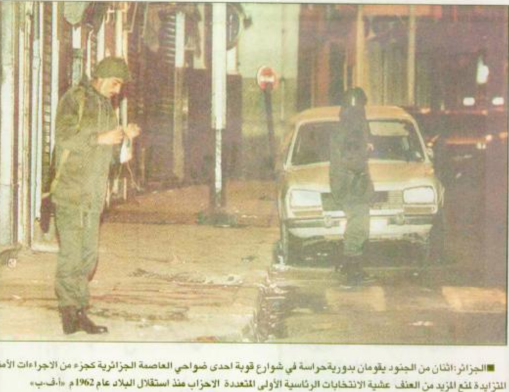
الجزائر: الثامن من الجنود يقومون بدورية حراسة في شوارع قوية احدى ضواحي العاصمة الجزائرية كجزء من الاجراءات الأمنية للزيادة لمنع المزيد من العنف عشية الانتخابات الرئاسية الأولى المتعددة الاحزاب منذ استقلال البلاد عام 1962 م - ج.أ.ب.