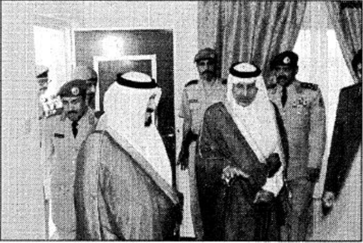
الأمير سلطان يستمع إلى شرح من أمير منطقة عسير عن مشروع خيرية الفيصل