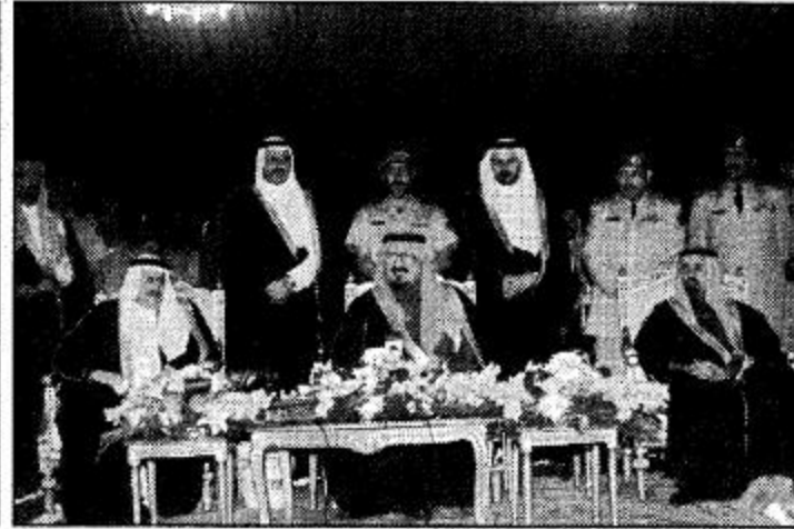
سموه يبرف حفل أهالي منطقة الباحة