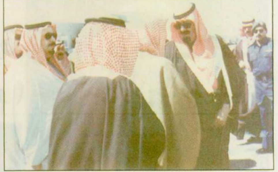
لقطات من مغادرة سمو ولي العهد الرياض الى حفر الباطن