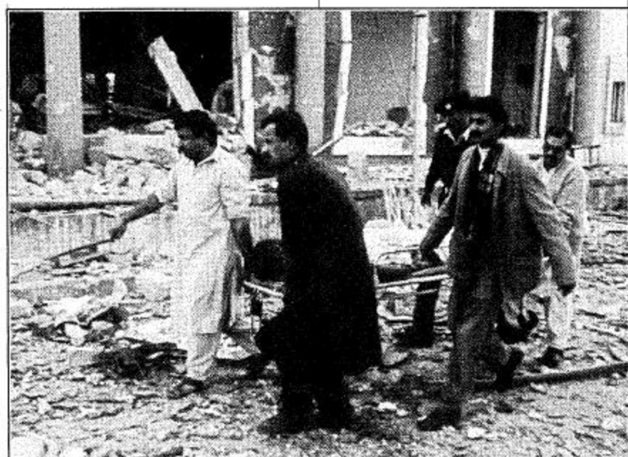
حطام السفارة المصرية في باكستان

وقال مسؤول في الشرطة ان «الارهابيين يملكون شبكة دولية لتبادل المعلومات لذلك من المنطقي ان نقرر تقاسم معلوماتنا».