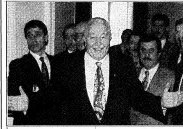
زعيم حزب الرفاه الاسلامي يستعد للترحيب بزعيم حزب الوطن

واقف كبار الساسة في حزبي الرفاه والمهاجرين الأتراك على الاجتماع مرة ثانية لمناقشة تقسيم المناصب الوزارية في ائتلاف حكومي محتمل قد يأتي بحلول رئيس وزراء الحزب الرفاه للجمهورية التركية التي اقيمت منذ 73 عاما.