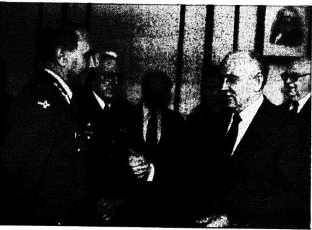
الرئيس السوفيتي ميخائيل جورباتشوف يتحدث مع قادة حلف الناتو الجنرال فيلجيك ايد نرويجي، ال اليسار والجنرال جون جالفن امريكي في الوسط قبل بدء المحادثات في الكرملين.