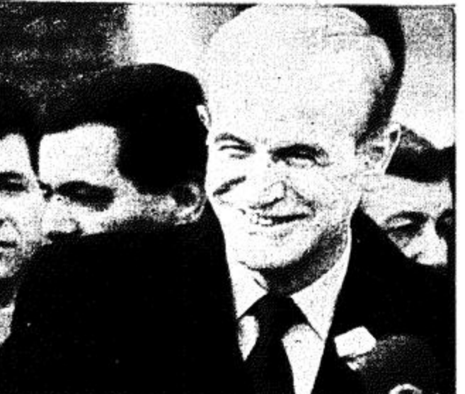
جنيف - ا.ب. الرئيس السوري حافظ الاسد يرد على اسئلة مراسل الصحف لدى وصوله الى جنيف يوم الجمعة حيث اجتمع مع الرئيس الامريكى جورج بوش.