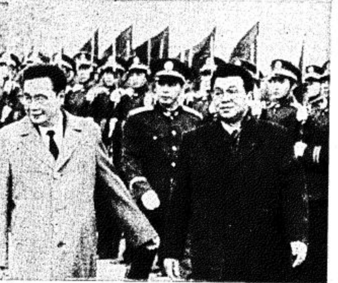
جنيف - ا.ب. رئيس وزراء كوريا الشمالية يون هيوونج موك (في اليمين) يستعرض حرس الشرف برفقة نظيره الصيني في بنج خلال مراسم استقباله في ميدان تيانانمن في بكين يوم الجمعة لدى وصوله في زيارة مدتها خمسة ايام للصين.