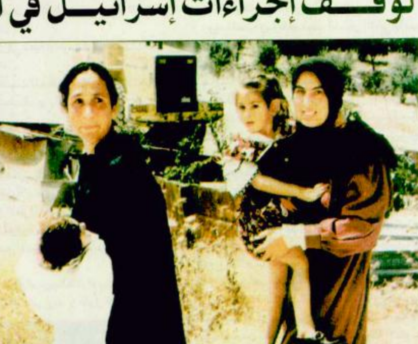
القدس - أ.ف.ب: امرأتان فلسطينيتان تحمسان طفلتهما الصغيرين بجانب جرافة الشرطة الإسرائيلية التي تهدم منزلهما.

واشنطن - القاهرة - رام الله - غزة - القدس - الوكالات - الجزيرة: أعربت الولايات المتحدة الأمريكية أمس عن عدم ترحيبها بعدد اجتماع لمجلس الأمن الدولي لبحث تداعيات الجمود الذي تعانته عملية السلام في الشرق الأوسط. واعتبر مسؤول أمريكي رفيع أن اللجوء إلى مجلس الأمن لاستصدار قرار يدين خطط إسرائيل التوسعية في القدس الشرقية قد يؤدي إلى نتيجة عكسية ويؤثر سلباً على الجهود الأمريكية لكسر الجمود المسيطر على عملية السلام منذ 16 شهراً مضت حتى الآن ونقلت مصادر دبلوماسية في «ستروب تاليوت» القائم بأعمال وزيرة الخارجية الأمريكية أنه أبلغ السفارة العرب المعتمدين في واشنطن في اجتماع بهم الليلة قبل الماضية أنه يترك أن من الطبيعي أن يكون هناك تفكير للتعامل مع المشكلة في مجلس الأمن إلا أنه يود أن يلفت النظر إلى دقة الوضع الحالي وأن أي محاولة لاستصدار قرار من مجلس الأمن سيؤدي إلى نتيجة عكسية. وقد تخل بالتوازن الدقيق اللازم للسير قدماً بعملية السلام هذا ومن ناحيته كان صاحب السمو الملكي الأمير بندر بن سلطان بن عبدالعزيز سفير خادم الحرمين الشريفين لدى الولايات المتحدة الأمريكية وعميد السلك ببقية، ص: ٢٩.