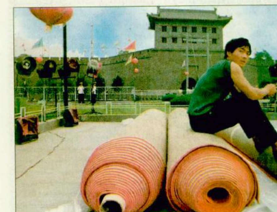
شيان - الصين - أ.ف.ب: أحد العمال يجلس على لفافات السجاد الاحمر قبل بدء بسطها في الميدان المواجه للبوابة الجنوبية لسور المدينة القديمة في شيان.

شيان - واشنطن - الوكالات: وصل الرئيس الأمريكي بيل كلينتون أمس الخميس، إلى الصين في زيارة رسمية. وقد هبطت طائرة «أير فورس وان» الخاصة بالرئيس الأمريكي في الساعة 7:15 مساءً بالتوقيت المحلي (١١:١5 بتوقيت جرينيتش) في مطار شيان الواقع على بعد 1,000 كيلومتراً جنوب غرب بكين. وسوف تكون مدينة شيان المحطة الأولى في زيارة كلينتون إلى الصين والتي تستغرق تسعة أيام. ويذكر أن هذه هي أول زيارة يقوم بها رئيس أمريكي إلى الصين منذ الزيارة التي قام بها جورج بوش في شباط/فبراير/ 1989 أي قبل أربعة أشهر من مجزرة ساحة تيانانمن التي سحقت الحركة الديمقراطية في الصين. ومن جهة أخرى عمدت وزيرة الخارجية الأمريكية مادلين أولبرايت إلى إثارة توقعات الصحفيين حول الشهاب التي ستزورها في مراسم استقبال الرئيس الأمريكي بيل كلينتون في ميدان تيانانمن في العاصمة الصينية بكين الذي شهد حملة القمع ضد الحركة الديمقراطية عام 1989. وتذكر راوي صوت أمريكا في تقرير له أمس أن أولبرايت كانت قد المنحت إلى أنها سوف ترتدي ثياباً بيضاء اللون وهو لون الحداد التقليدي في الصين إحياء لذكرى الطلبة المحتجين الذين لقوا حتفهم أثناء عمليات القمع وأشار التقرير إلى أنه من المعروف عن أولبرايت أنها أطلقتها لاشارة سياسية عن طريق اختيارها للحي والثياب.