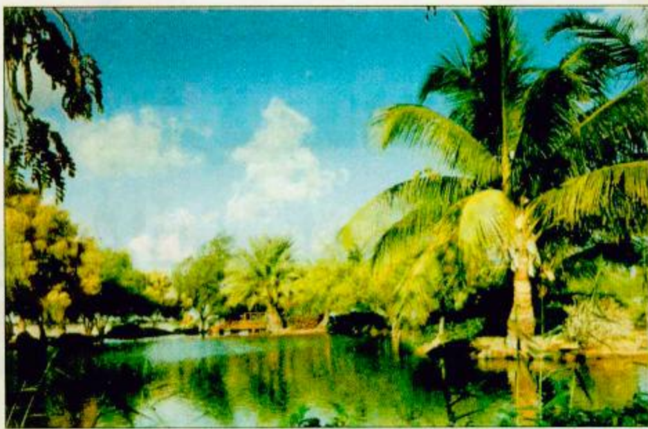
صورة تمثل الاهتمام البيئي في بنع الصناعية