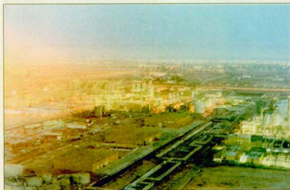
أحد المشاريع العملاقة لسابك في مدينة ينبع الصناعية