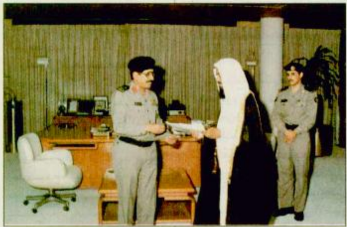
لقطات من التكريم

كتب/محمد العبدروس: تمكنت شرطة منطقة الرياض من الكشف عن احدي الجرائم الهامة وضبط مرتكبها، وذلك بمساعدة رابعة من ثلاثة مواطنين سعوديين، قدموا ادوارا هامة.