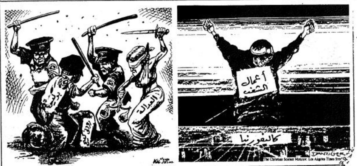
عمر (هيروالترينبون) الامريكية

خلال فترة زعامته التي دامت تسع سنوات، دار نيل كينوك بحزب العمال ١٨٠ درجة. لقد نقله بعيداً عن موقعه في اليسار وجعله يتخلى عن سياسته الخاصة بنزع السلاح من جانب واحد وتساميم اليونسك الكبرى والصناعة ورفض السير في طريق السوق الأوروبية المشتركة. انها القضايا التي كانت تميز حزب العمال عندما تسلمه السيد كينوك. البرنامج الذي طرحه هذا الزعيم القادم من ويلز لم يقنع الكثير من الناخبين، وبعضهم يعتقد اعتقاداً راسخاً أن نيل كينوك زعيم انتحاري.