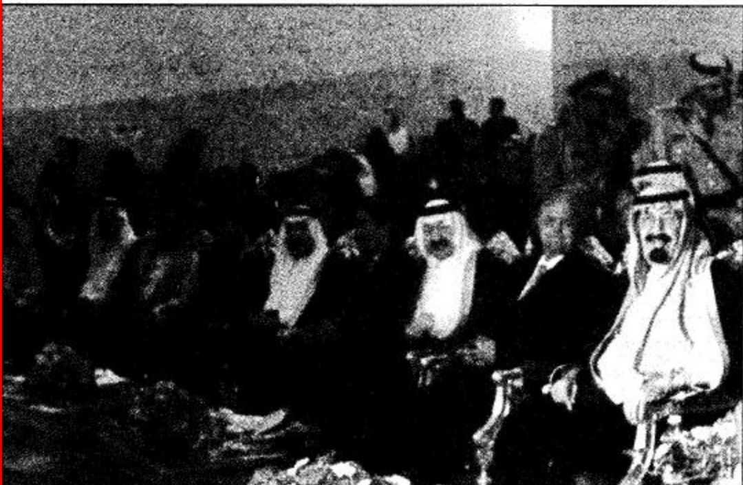
متابعة من سمو ولي العهد والوفد المرافق والحضور لبرامج الحفل