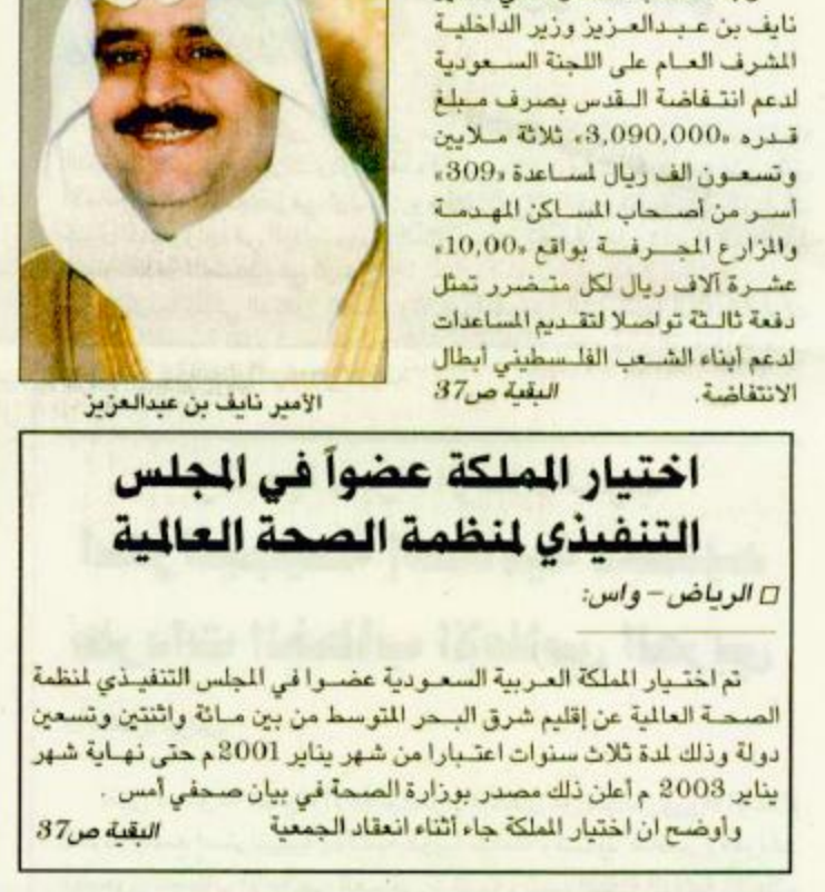
الأمير نايف بن عبدالعزيز

وجه صاحب السمو الملكي الأمير نايف بن عبدالعزيز وزير الداخلية المشرف العام على اللجنة السعودية لدعم انتفاضة القدس بصرف مبلغ قدره 3,090,000، ثلاثة ملايين وتسعون ألف ريال لمساعدة 809، أسر من أصحاب المساكن المهتمة والمزارع الجرسفة بواقع 10,00، عشرة آلاف ريال لكل مخرشر تمثل دفعة ثالثة تواصل لتقديم المساعدات لدعم أبناء الشعب الفلسطيني أبطال الانتفاضة. البقية ص 37