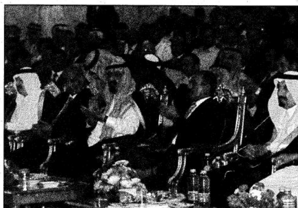
سمو ولي العهد والرئيس اليمني يحضران حفل مرور 11 عاماً على الجمهورية اليمنية