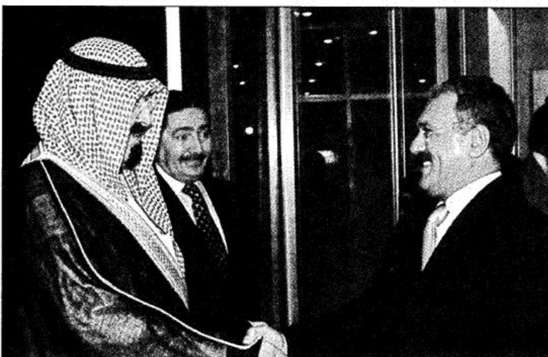
الرئيس اليمني في مقدمة مستقبلي سمو ولي العهد في حفل الأوبريت.