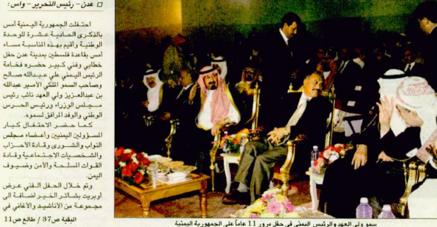
سمو ولي العهد والرئيس اليمني في حفل مرور 11 عاماً على الجمهورية اليمنية

احتفلت الجمهورية اليمنية أمس بالذكرى العاشرة للوحدة الوطنية وأقيم بهذه المناسبة مساء أمس بقاعة فلسطين بمدينة عدن حفل خطابي ورفي كبير حضره فضامة الرئيس اليمني علي عبدالله صالح وصاحب السمو الملكي الأمير عبدالله بن عبدالعزيز ولي العهد نائب رئيس مجلس الوزراء ورئيس الحرس الوطني والوفد المرافق لسمو. كما حضر الاحتفال كبار المسؤولين اليمنيين وأعضاء مجلس النواب والشورى وقادة الأحزاب والشخصيات الاجتماعية وقادة القوات المسلحة والأمن وضيفو اليمن. وتم خلال الحفل الفني عرض أوبريت بشائر الخير إضافة إلى مجموعة من الأناشيد والأغاني في البقية ص 37 / طالع 11