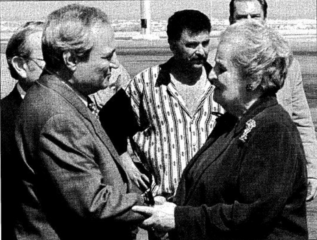
مدينتي سوريا وزير الخارجية السوري فاروق الشرع يرحب بوزيرة الخارجية الأمريكية مادلين أولبرايت لدى وصولها إلى دمشق.