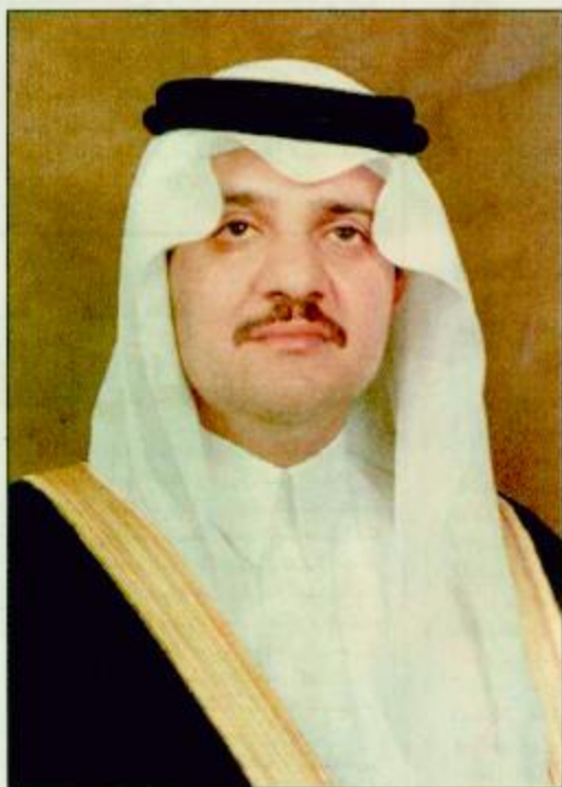
الأمير سعود بن نايف