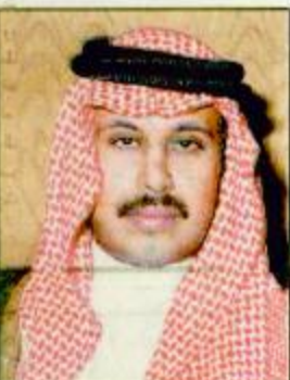
صاحب السمو الملكي الأمير مشاري بن سعود بن عبدالعزيز

واحاح المنطقة الشرقية بمدنها وقراها النابضة بالحياة والحب والفرح تؤكد الحقيقة الساطعة لموقع سمو ولي العهد الامين الامير عبدالله بن عبدالعزيز في وجدان الجماهير التي ساعدت بهذه الزيارة الميمونة المباركة للمنطقة الشرقية في وطن يصنع التحولات الحضارية... لقد عبرت الشرقية بكل فنائها عن عميق حبتها... وصادق مشاعرها لهذه الزيارة الكريمة وقيام سموه بافتتاح بعض المشاريع الوطنية التنموية ومنها وضع حجر الاساس لمدينة الامير عبدالله بن عبدالعزيز العسكرية العليا لهذا الوطن المعطاء وتاتي امتداداً للمنتجات والمشاريع الممتدة في كافة مناطق ومدن المملكة.