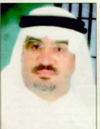
وكيل إمارة الأحساء