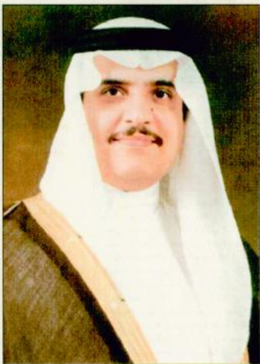
الأمير محمد بن فهد