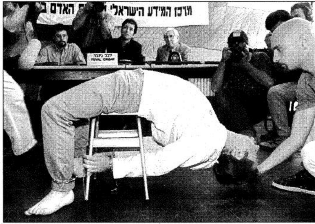
القائد (أ. ب.) عضو من مركز الإعلام الإسرائيلي لحقوق الإنسان، يسلم، يقوم بعمل بيان عن نموذج إرهابي مشبه به لثلاث الاستجواب مستخدماً أسلوب الخدمات العمالية الإسرائيلية حين بيت.