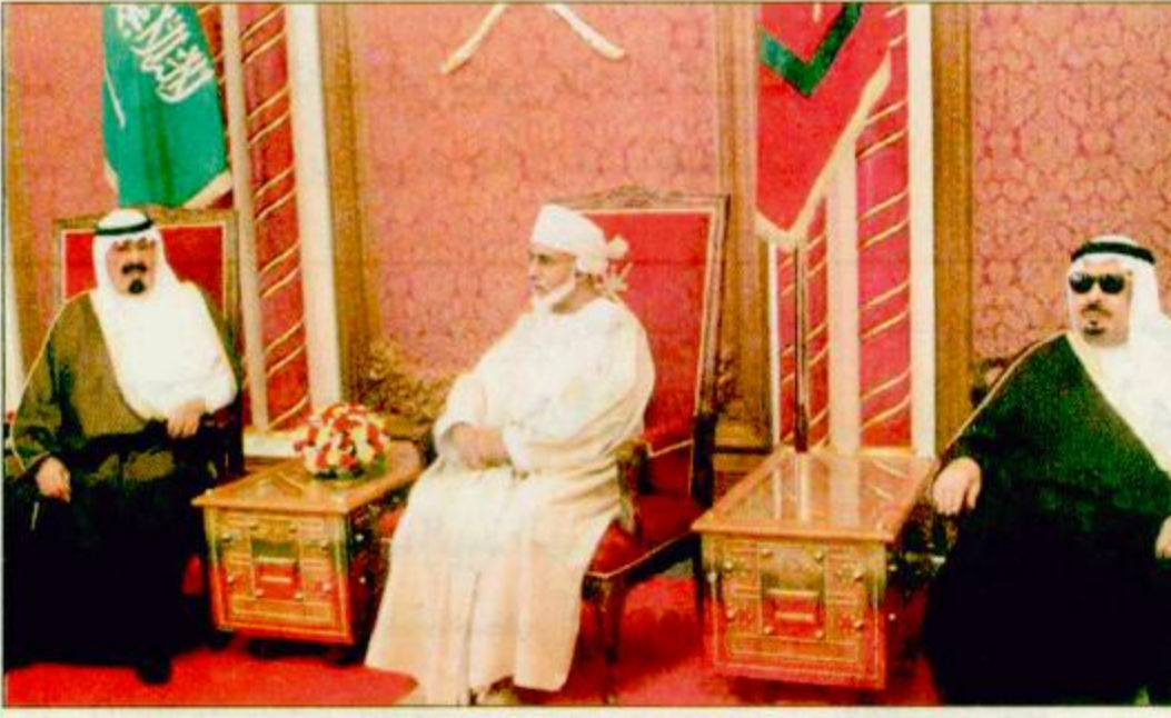
سمو ولي العهد مع السيد سلطان قابوس بحضور الامير بدر

وقال في البيان الصحفي الذي أدلى به سموه لدى وصوله الى مسقط أمس ليرأس وفد دولة الامارات العربية المتحدة في القمة التشاورية ان هذا اللقاء يأتي بعكس الإرادة الصادقة والحرص البالغ لاصحاب الجلالة والسمو قادة دول المجلس للتأكيد على الثوابت التي تقوم عليها سياستنا في التعاون والتنسيق والتعاظم المشترك ومواصلة العمل لانجاز المزيد من المكاسب التي تلمس لتطلعات وطموحات شعوب المنطقة في الأزهار والرخاء وتعزيز الامن والاستقرار والطمأنينة بما يقدم برامج التنمية بدول المجلس ويحقق المزيد من النهوض بمستوى شعوب المنطقة وأكد ثقة الكبيرة في ان هذا اللقاء سيشكل إضافة مهمة في ترسيخ مسيرة المجلس على جميع الأصعدة السياسية الاقتصادية والاجتماعية والامنية انطلاقا من صلابته الأرضية والشكرية والاعتماد السامية التي يسعى إلى تحقيقها من أجل مصلحة دوله وشعبه.