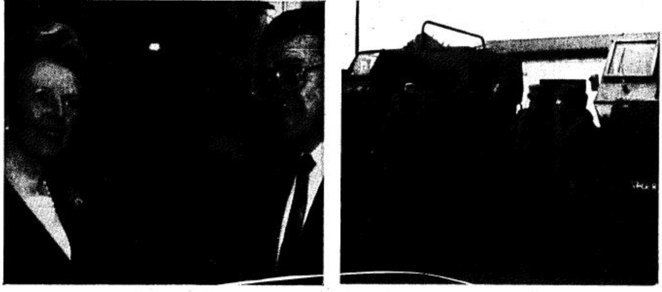
توكوزا - جنوب افريقيا (أب) جنود يقفون امام عرباتهم المدرعة في الفجر عقب مناوبة ليلية في حراسة مدخل فندق في اطلال عملية القبضة الحديدية من اجل وضع حد...