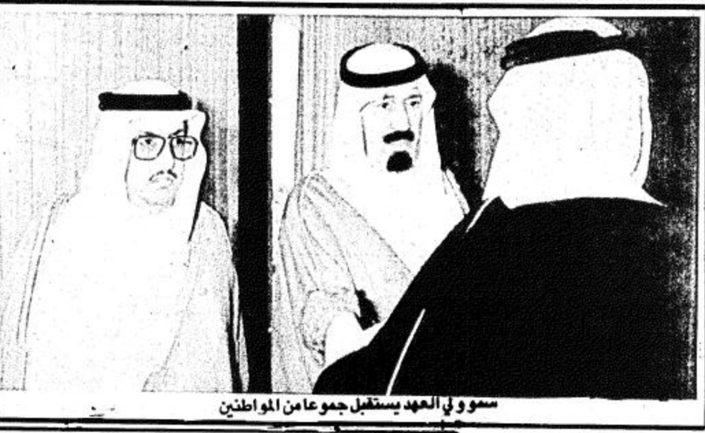
سمو ولي العهد يستقبل جموعاً من المواطنين