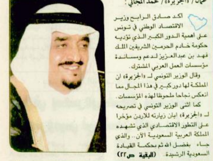
عماد / الجزيرة / محمد الجاهلي

أكد صادق الرايحي وزير الاقتصاد الوطني في تونس