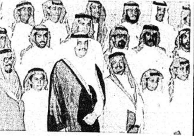
الأمير محمد بن فهد يستقبل الطلبة المتفوقين

وفد من الشركة برئاسة د. الطويل توجه الى الصين الشعبية لحضور الحفل