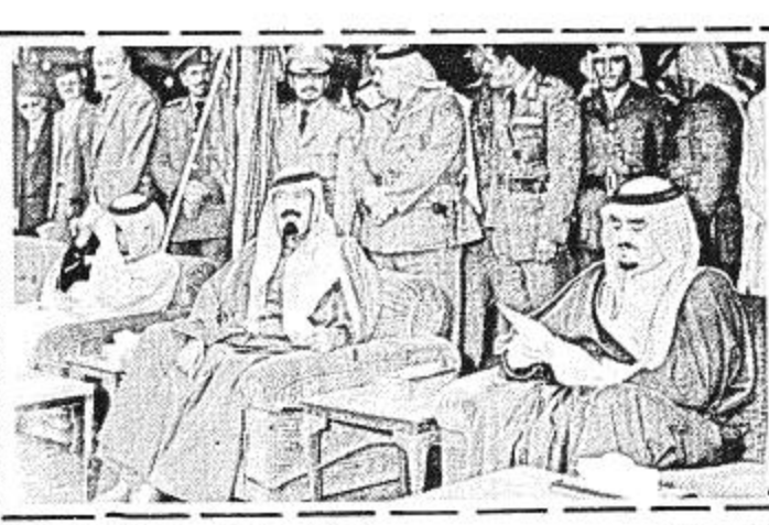
المعجزات : وأرب سموه من عمله في التزيد من للمملكة عموماً في جميع المجالات كما

وجه سمو الأمير فهد بن عبد العزيز في ختام تصريحه الشكر الجزيل لصاحب السمو الملكي الأمير عبد الله بن مسعود وزير الدفاع والطيران والعمليات في القوات المسلحة والجناب الكيني برئاسة السيد