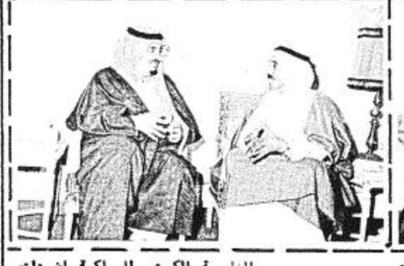
الاجواء العربية : وادك الشيخ صباح الاحمد ان هذه الاتصالات ليست مساطة بقدر ما هي تشاور لما يمكن ان نعمله في المنطقة العربية بهيكل التنسيب والتعاون العربي كما مر صاحب السمو الملكي الامير سعود الفيصل وزير الخارجية بان زيارة الشيخ صباح الاحمد وزير

صباح الاحمد : زيارة للمملكة ليست للمواطاة بقدر ما هي للتشاور فيما يمكن أن نعمله سعود الفيصل : استمر التنسيب النابع من الشعور بالواحد تجاه الأوضاع التي تمر بها الأمة