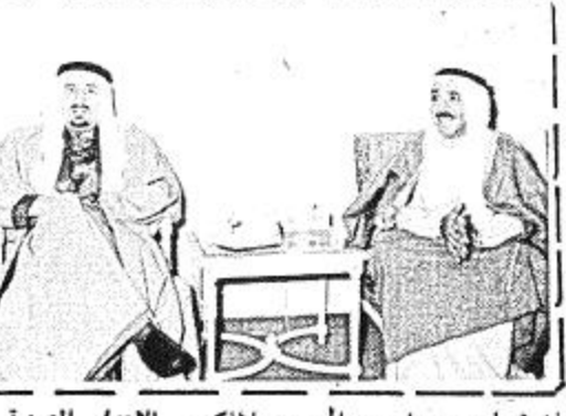
وكان في استقباله بالطيار صاحب السمو الملكي الامير سعود الفيصل وزير الخارجية وعدد من المسؤولين وقد مرع الشيخ صباح الاحمد الجابر وزير الخارجية الكويتي الذي وعسوله اس الى الرياض ياتنه يعمل رسالة الى جلالة الملك خالد ابن عبد العزيز المنسوخ من سمو الشيخ صباح السالم الصباح امير الكويت وقال الوزير ان زيارته للمملكة تاتي امتداداً لما تم الاتفاق عليه بين المملكة والكويت على استمرار التشاور سواء فيما يخص العلاقات الثنائية او فيما يتعلق بالمسائل العربية الراهنة واوضح الشيخ صباح الاحمد بان هذه الزيارة مستحقة له فرصة التشاور مع صاحب السمو الملكي الامير سعود الفيصل وزير الخارجية حول ما يقوم به البلدان من تهيئة

عقد قبل ظهر امس اجتماع بين الجانب السعودي برئاسة صاحب السمو الملكي الامير سعود الفيصل وزير الخارجية والجانب الكيني برئاسة السيد