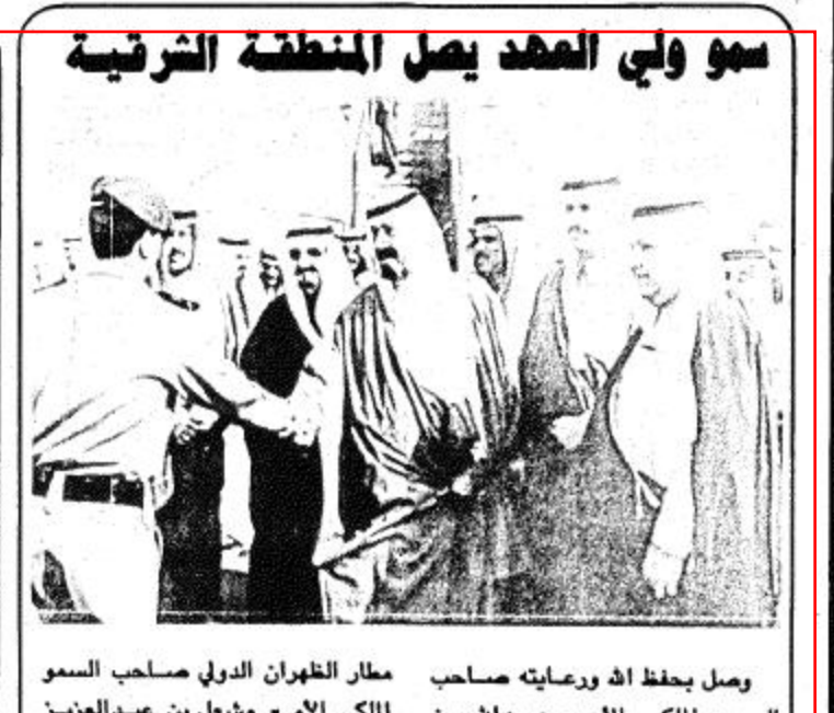
مطار الظهران الدولي صاحب السمو الملكي الأمير سعود الفيصل وزير الخارجية وأعضاء السلك الدبلوماسي المصري والإسلامي والأجنبي لسدى الملكة. وبعد أن صرف السلام الملكي السعودي فالسلام الفلسطيني قام السيد ياسر عرفات بحضور صاحب السمو الملكي الأمير سلمان بن عبدالعزيز وصاحب السمو الملكي الأمير سعود الفيصل برقع علم دولة فلسطين على

سعيدة وحلم يتحقق وتلك خطوة ان شاء الله سيكون لها ما وراءها. صرح بذلك صاحب السمو الملكي الأمير سلمان بن عبدالعزيز أمير الرياض لدى رعاية حفل رفع علم فلسطين على سفارة دولة فلسطين مناسبة الرياض/ محمد العبدروس القاهرة/ (الجزيرة): وان مشاركتنا اليوم في حفل رفع علم فلسطين على سفارة دولة فلسطين مناسبة