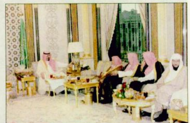
سمو ولي العهد يستقبل وزير الحج وأئمة الحرمين المكي والنبوي - واس

أكد صاحب السمو الملكي الأمير عبد الله بن عبد العزيز ولي العهد نائب رئيس مجلس الوزراء رئيس الحرس الوطني حرص حكومة خادم الحرمين الشريفين الملك فهد بن عبدالعزيز آل سعود على تطوير ما تقدمه الأجهزة المختصة من خدمات تمكن المعتمر والحاج من أداء شعائرهم الدينية بيسر وسهولة.