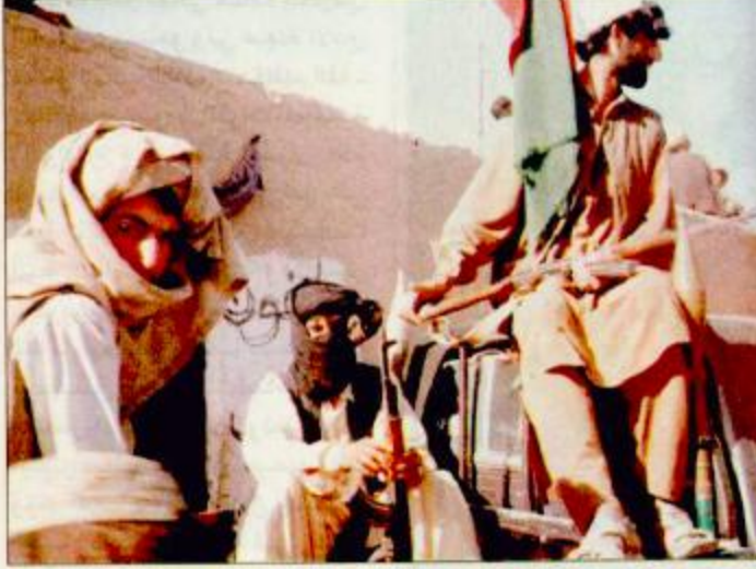
مقاتلو القبائل يحرسون قرية سين بولداك

كابول - قندهار - الوكالات: باكستان مقر لها ان «حكم طالبان لأفغانستان انتهى تماماً». وكانت طالبان وافقت على تسليم زابول واقليمي قندهار وهلمند المجاورين وفقاً البقية ص 35 وأمريكا بدأت الحرب ص 36 . ص 37