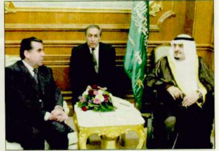
خادم الحرمين الشريفين يعقد اجتماعاً مع رئيس جمهورية طاجيكستان - واس

استقبل خادم الحرمين الشريفين الملك فهد بن عبدالعزيز آل سعود في مكتبه بقصر الصفا بمكة المكرمة أمس فخامة الرئيس الطاجيكي رحمانوف رئيس جمهورية طاجيكستان والوفد المرافق له. وقد عقد خادم الحرمين الشريفين الملك فهد بن عبدالعزيز آل سعود وفخامة الرئيس الطاجيكي رحمانوف اجتماعاً تم خلاله بحث أهم المستجدات على الساحتين الإسلامية والدولية واستعراض