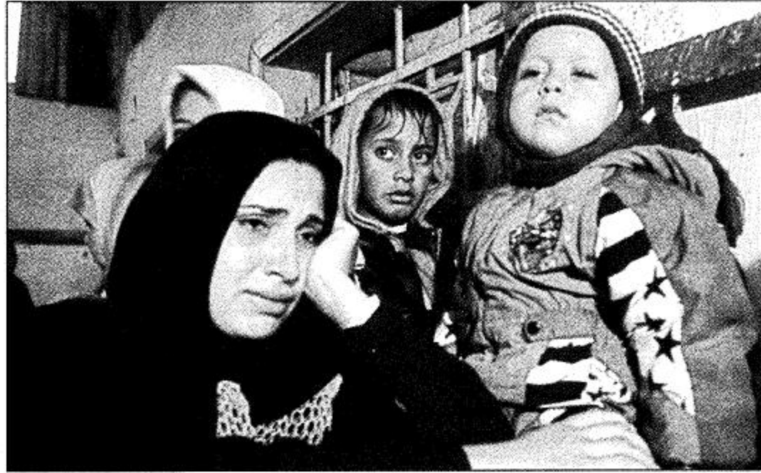
فتاة فلسطينية تبكي حزناً على أخيها الذي سقط شهيداً خلال هجوم قوات الاحتلال على غزة.

كتب عرفات في مدينة رام الله بالضفة الغربية أثناء وجوده داخله. وجاءت هذه العبارات في إطار الاعتداءات الإسرائيلية المتواصلة وفي أعقاب ثلاث عمليات استهداف فلسطينية داخل إسرائيل على رموز سلطة الرئيس ياسر عرفات. وقال مروان جيلاني عضو الوفد الفلسطيني لدى الأمم المتحدة أن مجلس الأمن امتنع في السابق عن اتخاذ إجراء بسبب تهديد أمريكي باستخدام حق النقض «الفيتو» بحجة أن واشنطن تساعد في التوسط في الصراع. لكنه أضاف أن الحال لم يعد كذلك قائلًا «إننا لم نرى إجراء من الولايات المتحدة لكي يحجم الحكومة الإسرائيلية أو منع تفاقم هذا الوضع». وشنت طائرات إسرائيلية يوم الثلاثاء وأعلنت أنها ستقوم بتدمير أهداف عسكرية في الضفة الغربية. وقال جيلاني للمصنفين إن البعثة الفلسطينية لدى الأمم المتحدة بعثت برسالة إلى مجلس الأمن تطالب اجتماعاً.