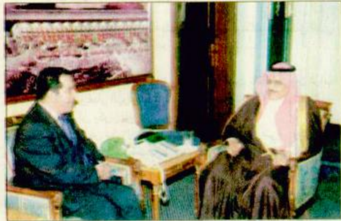
الأمير نايف لدى استقباله السفير التونسي