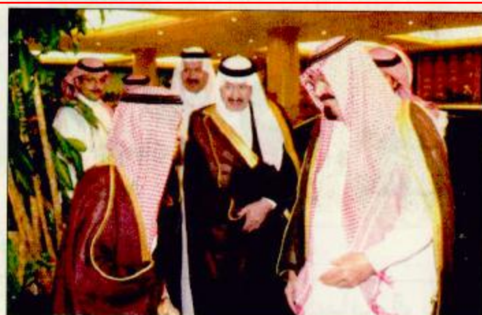
سمو ولي العهد يصل مكة