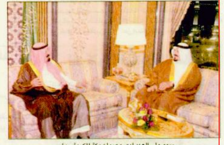
سمو ولي العهد لدى وصوله مكة المكرمة - واس

تلقى صاحب السمو الملكي الأمير عبدالله بن عبدالعزيز ولي العهد ونائب رئيس مجلس الوزراء ورئيس الحرس الوطني اتصالاً هاتفياً أمس من فخامة الرئيس الجنرال پرويز مشرف رئيس جمهورية باكستان الإسلامية. وجرى خلال الاتصال بحث تطورات الأوضاع الإسلامية والدولية الراهنة والعلاقات الثنائية بين البلدين الشقيقين وسبل دعمها وتعزيزها.