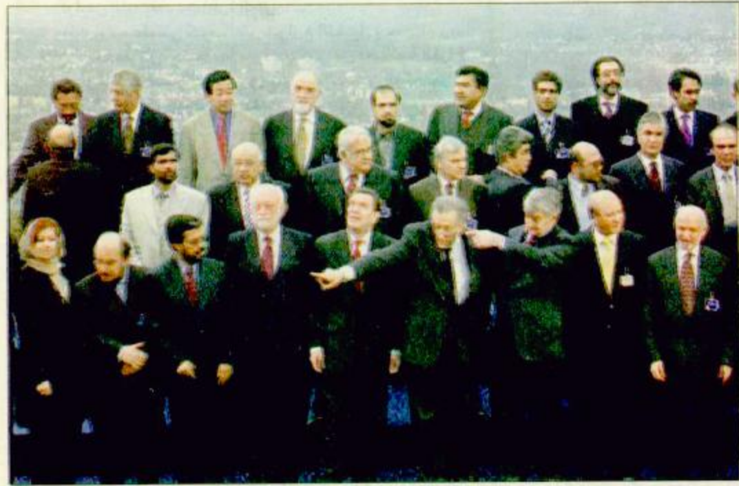
لقطة جماعية للأعضاء المشاركين في مؤتمر بون