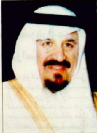
الأمير سلطان بن عبدالعزيز

وقع صاحب السمو الملكي الأمير سلطان بن عبدالعزيز النائب الثاني لرئيس مجلس الوزراء وزير الدفاع والطيران والمفتش العام عقد دعم وتشغيل وصيانة نظام الملاحة الجوية الذي جرى طرحه في مناقسة عامة وتمت ترسيته على إحدى الشركات الوطنية بقيمة إجمالية تتجاوز 368 مليون ريال ودة ثلاث سنوات ويتميز هذا العقد بكثير من التقنيات والنظم المتقدمة في هذا المجال الحيوي. ويتألف المشروع من عدد من الأنظمة منها ما يتعلق بالتشغيل الآلي والاتصالات والرادارات بالإضافة إلى نظم المساعدات الملاحة التي تعمل جميعها في ترابط وتجانس تام على مدى الأربع والعشرين ساعة وعلى مدار العام وذلك بدعم نظام المراقبة الجوية الذي يعمل على تأمين سلامة الحركة الجوية في أجواء المملكة التي تستفيد من خدماتها أكثر من 100 شركة طيران عالمية عابرة أو هابطة في إحدى مطاراتها إلى جانب حركة الطائرات السعودية المدنية والعسكرية مما يكفل انسداد الحركة الجوية في أمن وسلامة ودفقة وفاعلية. ويقوم المشروع إلى جانب ما يوفره من عمالة فنية لتشغيل وصيانة تلك النظم الملاحة بدور تدريبي البقية ص 34