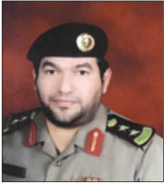
العقيد عبدالله الحقباني

وطنية وإقليمية ودولية شجاعة ومنجزات لا تحصى في مؤسسات الدولة والمجتمع السعودي في التعليم وفي الأمن وفي نظام المناطق وتطويرها. وشهد النقيب ثامر السماري على أن الملك سلمان -حفظه الله- خير من أتى بعد الملك عبدالله الذي شهد فيه الحرمان أوسع توسعة على الإطلاق ليكمل بناءها الشامخ الملك سلمان وفي ذات السياق هنا السماري الملك سلمان بتوليه مقاليد الحكم والسلطة سائلاً الله أن يوفقه ويسدده داعياً المولى عز وجل أن يتغمّد بواسع غفرانه ورحمته سائلاً الله تعالى أن يمد الملك سلمان بمساعدته الأمير مقرن وولي ولي عهده الأمير محمد. رئيس رقباء مبارك القحطاني مدير شعبة دوريات أمن الدلم قال إن توافد الجموع على قصر الحكم منذ وقت مبكر وعلى مدار الأسبوع معزين مبايعين لدليل على محبة فقيد العالم الذي شارك رؤساء وممثلوه في الصلاة عليه والعزاء ومن ثم تقديم المبايعات مع الحضور الإعلامي الذي صاحب الحدث الجلل ومبايعته خليفته خادم الحرمين الشريفين الملك سلمان الذي أكد على الاستمرار في لقب خادم الحرمين وهو لقب حبه سلفه الملك عبدالله واستمر عليه خليفته الملك سلمان بن عبدالعزيز. رحم الله الفقيد وأدام عز الملك سلمان بتوفيق منه ومن ولي عهده وولي ولي العهد.