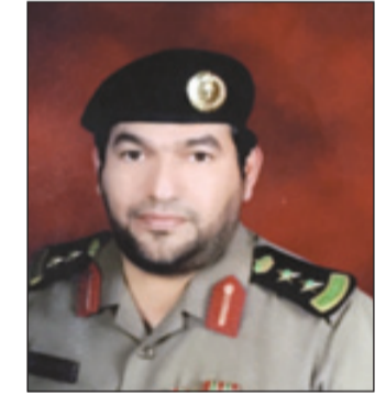
العقيد عبدالله الحقباني

وطنية وإقليمية ودولية شجاعة ومنجزات لا تحصى في مؤسسات الدولة والمجتمع السعودي في التعليم وفي الأمن وفي نظام المناطق وتطويرها. وشدد النقيب ثامر السماري على أن الملك سلمان -حفظه الله- خير من أتى بعد الملك عبدالله الذي شهد فيه الحرمان أوسع توسعة على الإطلاق ليكمل بناءها الشامخ الملك سلمان وفي ذات السياق هنا السماري الملك سلمان بتوليه مقاليد الحكم والسلطة سائلاً الله أن يوفقه ويسدده داعياً المولى عز وجل أن يتغمد بواسع غفرانه ورحمته سائلاً الله تعالى أن يمد الملك سلمان بمساعدته الأمير مقرن وولي ولي عهده الأمير محمد. رئيس رقباء مبارك القحطاني مدير شعبة دوريات أمن الدلم قال إن توافد الجموع على قصر الحكم منذ وقت مبكر وعلى مدار الأسبوع معزين مبايعين لدليل على محبة فقيد العالم الذي شارك رؤساء وممثلوه في الصلاة عليه والعزاء ومن ثم تقديم المبايع مع الحضور الإعلامي الذي صاحب الحدث الجلل ومبايعه خليفته خادم الحرمين الشريفين الملك سلمان الذي أكد على الاستمرار في لقب خادم الحرمين وهو لقب حبه سلفه الملك عبدالله واستمر عليه خليفته الملك سلمان بن عبدالعزيز. رحم الله الفقيد وأدام عز الملك سلمان بتوفيق منه ومن ولي عهده وولي ولي العهد.