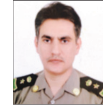
المقدم محمد المخضوب

وطنية وإقليمية ودولية شجاعة ومنجزات لا تحصى في مؤسسات الدولة والمجتمع السعودي في التعليم وفي الأمن وفي نظام المناطق وتطويرها. وشدد النقيب ثامر السماري على أن الملك سلمان -حفظه الله- خير من أتى بعد الملك عبدالله الذي شهد فيه الحرمان أوسع توسعة على الإطلاق ليكمل بناءها الشامخ الملك سلمان وفي ذات السياق هنا السماري الملك سلمان بتوليه مقاليد الحكم والسلطة سائلاً الله أن يوفقه ويسدده داعياً المولى عز وجل أن يتغمد بواسع غفرانه ورحمته سائلاً الله تعالى أن يمد الملك سلمان بمساعدته الأمير مقرن وولي ولي عهده الأمير محمد. رئيس رقباء مبارك القحطاني مدير شعبة دوريات أمن الدلم قال إن توافد الجموع على قصر الحكم منذ وقت مبكر وعلى مدار الأسبوع معزين مبايعين لدليل على محبة فقيد العالم الذي شارك رؤساء وممثلوه في الصلاة عليه والعزاء ومن ثم تقديم المبايع مع الحضور الإعلامي الذي صاحب الحدث الجلل ومبايعه خليفته خادم الحرمين الشريفين الملك سلمان الذي أكد على الاستمرار في لقب خادم الحرمين وهو لقب حبه سلفه الملك عبدالله واستمر عليه خليفته الملك سلمان بن عبدالعزيز. رحم الله الفقيد وأدام عز الملك سلمان بتوفيق منه ومن ولي عهده وولي ولي العهد.