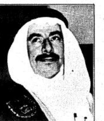
من الله تعالى وعونه ثم بتوجيهات قائد المسيرة

عبر معالي وزير الشؤون البلدية والقروية الدكتور محمد بن ابراهيم الجارالله شكره وتقديره لمقام خادم الحرمين الشريفين وولي عهده الامين وسمو النائب الثاني لرئيس مجلس الوزراء وزير الدفاع والطيران على منحه امه تلك الثقة الغالية بتعيينه وزيرا للشؤون البلدية والقروية وقال معاليه في تصريح للجزيرة ان ثقة