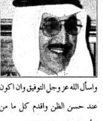
بن جعفر بن ابراهيم بن فقيه

عبر معالي وزير التجارة الأستاذ اسامة بن جعفر بن ابراهيم بن فقيه لـ «الجزيرة» عن شعوره بهذه الثقة الملكية قائلا: بلا شك ان هذه الثقة الملكية يعتر بها كل مواطن في هذه الارض الحرة واتمنى ان اخدم هذا الوطن والمشاركة في المسيرة الشاملة التي تعيشها في ظل قيادة خادم الحرمين الشريفين الملك فهد بن عبد العزيز آل سعود حفظه الله وهذه الثقة هي فخر لي ووسام شرف اعتر به